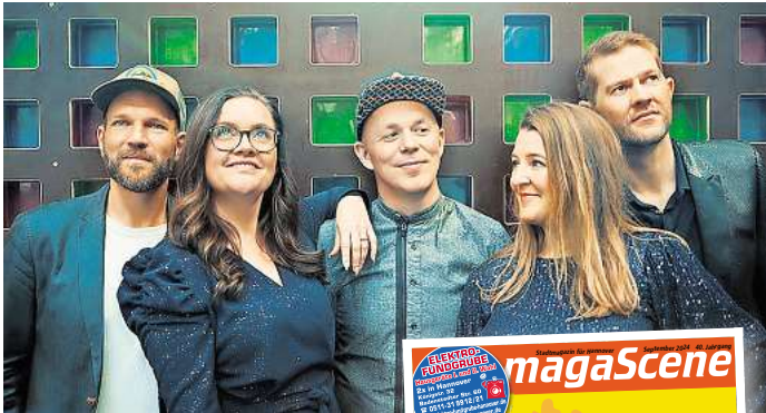
Postyr aus Dänemark – am 26. September im Pavillon

Unter dem Motto „Auf- und Umbrüche – neue Perspektiven für die Chormusik“ gibt es über 150 Workshops und Masterclasses, ein großes digitales Angebot und ein frei zugängliches Forum im HCC mit Talks, Diskussionsrunden und einer Messe mit rund 60 Fachausstellern, das gibt Interessierten die Möglichkeit zum Austausch und zum Entdecken neuer Trends. Das Herzstück der chor.com und für die meisten von Euch sicherlich am interessantesten, sind die 22 Konzerte. Hier zeigen nationale und internationale Ensembles die Vielseitigkeit und neue Trends der Vokalmusikszene. Da lohnt sich auf jeden Fall ein Blick auf das komplette Programm auf der untenstehenden Webseite der Veranstaltung, denn Vokalmusik 2024 ist viel mehr, als man vielleicht erwarten würde. Die Konzerte finden an verschiedenen Orten statt. Mit dabei sind die Christuskirche, das Kulturzentrum Pavillon, die Neustädter Hof- und Stadtkirche und die Galerie Herrenhausen. Hier nur einige Highlights aus dem Programm: Die preisgekrönte Gruppe Postyr aus Dänemark wird am 26. September im Pavillon zeigen, dass Vokalmusik und Computer ganz hervorragend zusammenpassen. Die Vokal-Band hat mit E-Cappella ein musi-