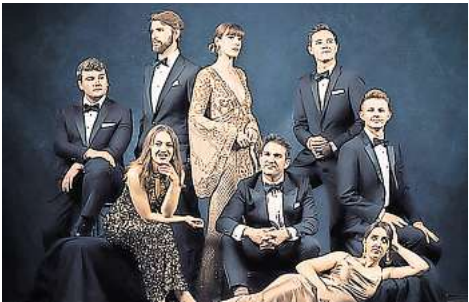
Das für den Grammy nominierte Ensemble Voces8 aus Großbritannien – am 27. September, Christuskirche

Viele weitere, spannende Neuigkeiten aus der lokalen Kulturszene finden Sie in der aktuellen Ausgabe Unseres Partnermediums magaScene, monatlich frisch gedruckt und kostenlos an über 500 Auslegestellen in Hannover oder online auf www.magascene.de inklusive Download-Möglichkeit.