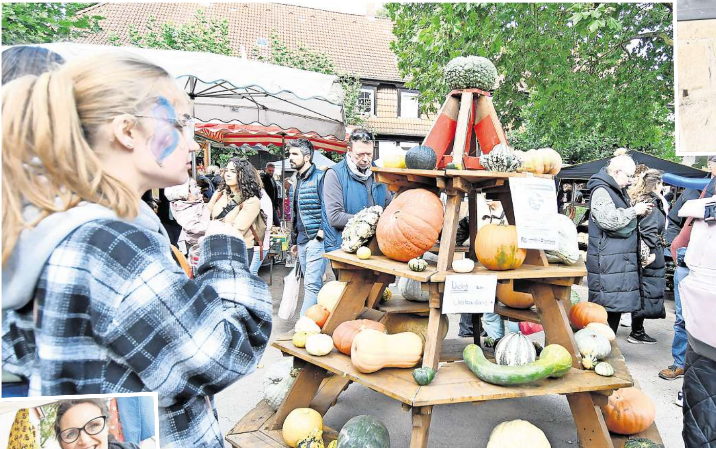
Großer Andrang: Tausende Besucher kommen zum Kürbisfest nach Wilkenburg.

Am Sonnabend konnten Gäste einen 75-Euro-Verzehrgutschein für das Kürbisfest gewinnen. Sie sollten schätzen, wie viel die 75 Kürbisse zusammen wiegen, die der Eldagser Hoflie-