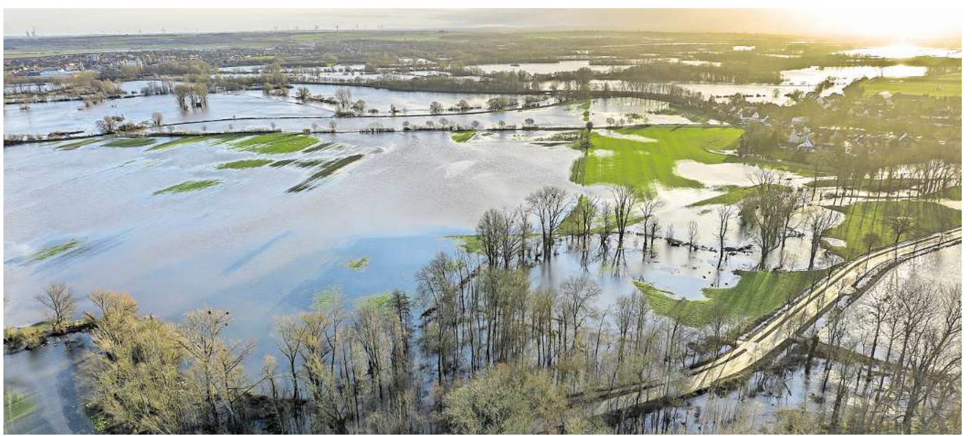
Land unter: Die CDU-Ratsfraktion in Hemmingen fordert einen Deichbau.

Mit dem Annagen und Fällen von Bäumen gehe es jetzt üblicherweise wieder los, sagt Gilster. Der Platz im und am künstlichen Gewässer in Laatzen-Mitte ist für das Tier jedoch begrenzt. „Der Stückenfeldteich ist als dauerhaftes Revier eigentlich nicht groß genug“, weiß die Biologin, „aber das muss der Biber selbst feststellen.“ Mutmaßlich nach dem Winter oder spätestens 2026 werde er wohl weiterziehen. Dann, wenn er feststellt, dass das Nahrungsangebot nicht ausreicht. Für den kommenden Winter werde er hingegen wohl noch einiges an Bäumen fällen. Akuter Handlungsbedarf bestehe aus Sicht des Naturschutzes nur, wenn der Biber häufiger die Straße quert und eine Gefahr für sich sowie andere darstellt. Immerhin wurde er in den Sommerferien schon einmal auf der Würzburger Straße gesichtet, so Gilster: „Wenn er zu häufig über die Straße wechselt, muss er umgesiedelt werden.“ Wie die Stadt erklärte, würden die Bäume am Teich fortlaufend engmaschig überwacht. Je nachdem, wie stark der Biber seine Aktivitäten fortsetze, könnten einzelne der verbliebenen rund 25 Bäume auch schon früher entnommen werden müssen.