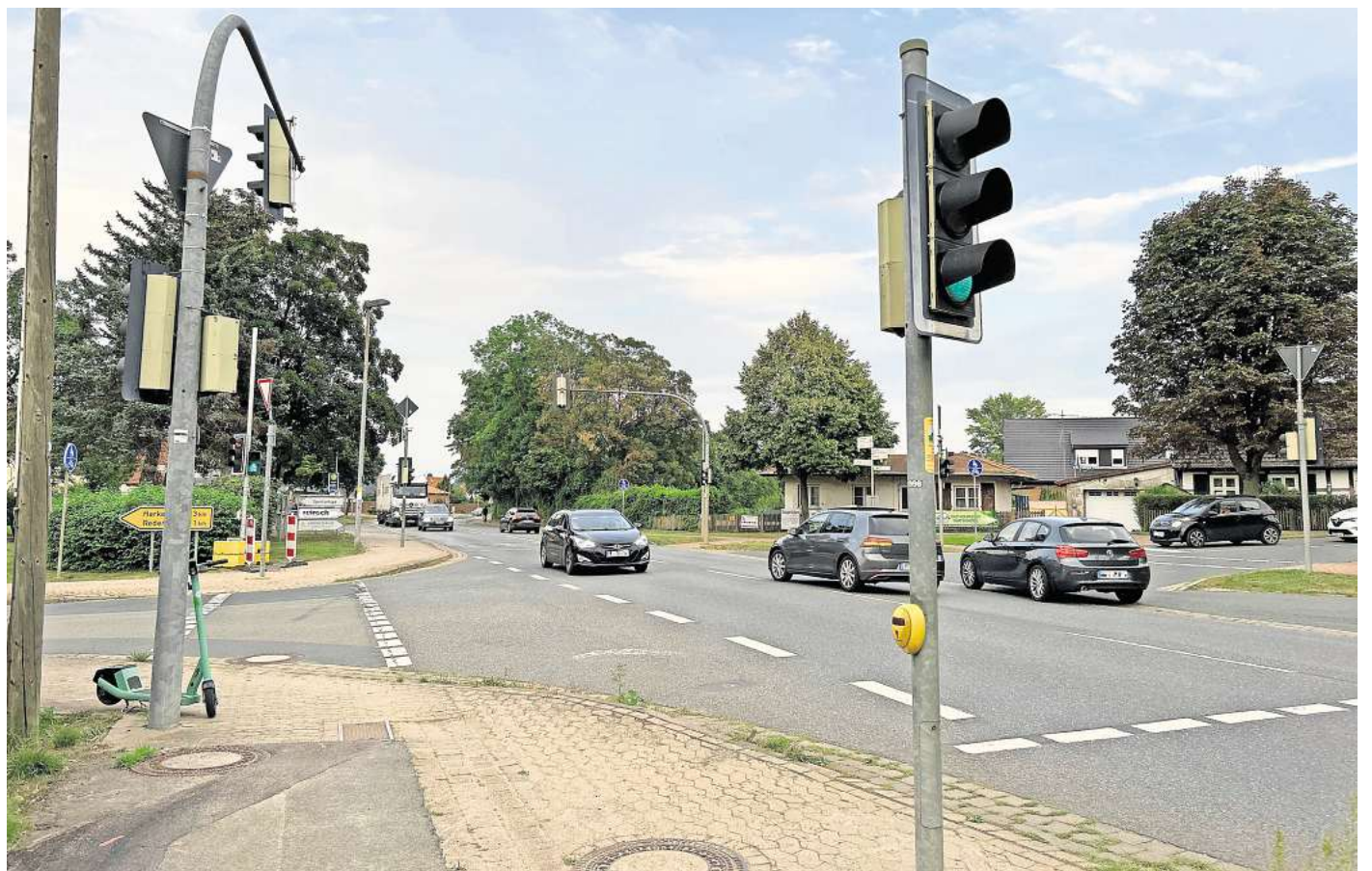
Bald nur noch langsam zu befahren? Von der Ampel bis zum östlichen Ortsausgang Koldings möchte die Stadt Pattensen zur Lärmberuhigung gerne Tempo 30 auf der Ortsdurchfahrt einführen.

Darüber hinaus sieht die Landesbehörde den Verkehrsfluss im Ort gefährdet. „Eine Bundesstraße nimmt übergeordnete Verkehre auf. Die B443 ist beispielsweise eine der Haupttrassen in Richtung Messe“, sagt