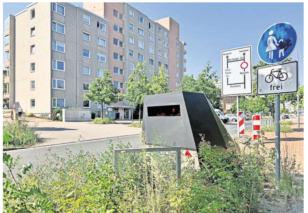
Die Stadt Laatzen testet seit Ende August den Einsatz einer semistationären Geschwindigkeitsmessanlage. Der Aufstellort des mobilen Blitzers kann flexibel gewählt werden.

dem den wesentlichen Nachteil, dass Ortskundige ihre Fahrweise in dem Abschnitt anpassen und davor sowie danach wieder ungehindert ordnungswidrig handeln könnten, so Hanenkamp-Ley. „Vonseiten der Verwaltung wurde daher eine semistationäre Geschwindigkeitsmessanlage vorgeschlagen, da diese einen ähnlichen Zweck erfüllt, aber deutlich flexibler eingesetzt werden kann.“