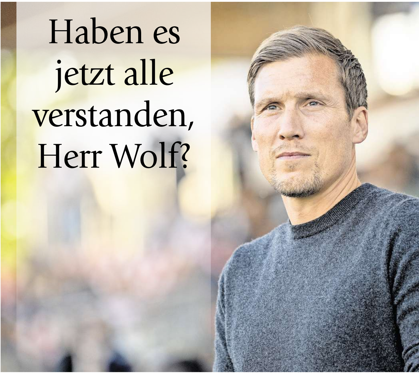
„Ziel ist, dass all unsere Spieler ein paar Prozent besser werden“: Und dazu braucht es laut Hannes Wolf viel Zeit am Ball.

Ist Ihre Reform in der Breite bei den Vereinen denn mittlerweile angekommen? Die Zustimmung ist grandios, unsere Trainingsphilosophie kommt in den Vereinen gut an. Es gab eine Wissenslücke, gewisse Themen waren nicht ausreichend erklärt, so kam die Kritik. Jeder, der sich mit den Entwicklungen beschäftigt, kann nur zu dem Schluss kommen, dass bei Sechsjährigen ein Drei- gegen-drei auf mehreren Fel-