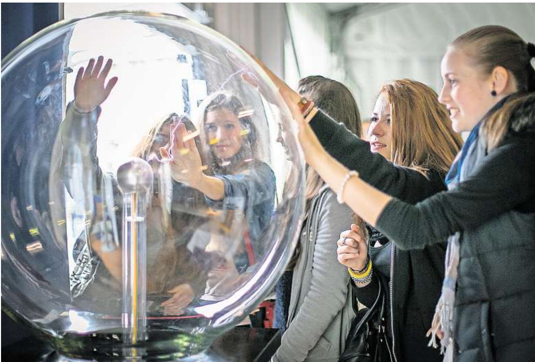
Eine interaktive Physik-Ausstellung kommt auf den Ernst-August-Platz.