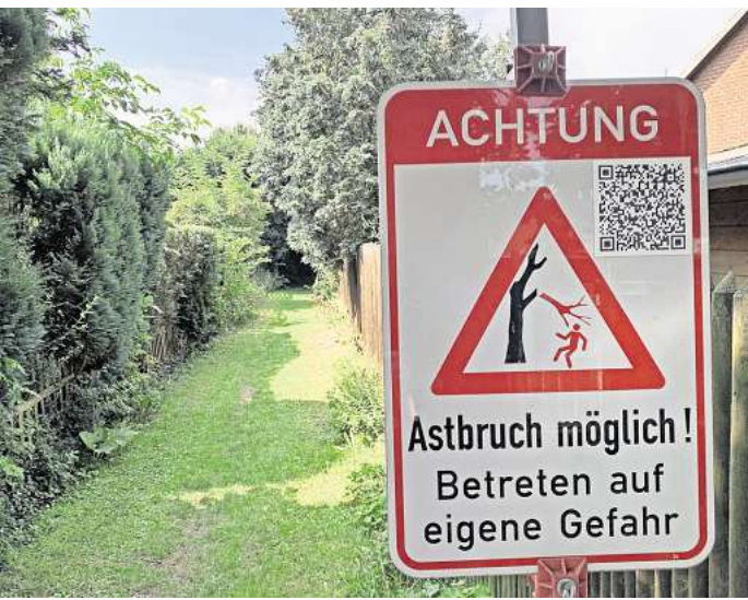
Warnschild am Köllnbrinkweg in Hemmingen-Westerfeld: Äste können abbrechen und auf Fußgänger und Fußgängerinnen fallen.

► Was nun? Die Stadt pflanzt zurzeit vermehrt auf öffentlichen Grünflächen und Grünzügen. Doch irgendwann wird die Kapazität auf diesen Flächen erschöpft sein. Pflanzungen in der freien Landschaft und an Wirtschaftswegen seien wegen der „vorgebrachten Bedenken und Anforderungen seitens der Landwirtschaft nur selten“, argumentiert der Betriebshof. Es geht dabei nicht nur um den Standort. Die Stadt muss unter anderem auf