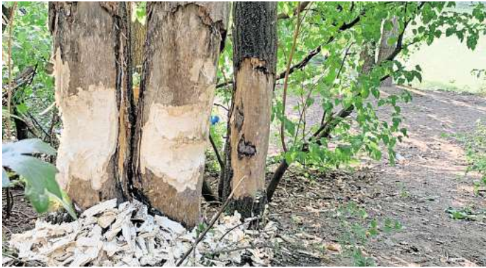
Frische Bisspuren des Bibers: Die beiden Bäume an der Ostseite des Stückenfeldteichs hat die Stadt kurzfristig fällen lassen.

Auch Ortsbürgermeister Bernd Stuckenberg (SPD) sprach sich für den Erhalt aus und gab sich optimistisch. Er gehe nicht davon aus, dass die genannten Fällzahlen nötig sein werden. „Das wird nicht die Menge sein“, so Stuckenberg. Aus Sicht der Stadtverwaltung sind nicht nur Sicherheitsaspekte entscheidend, vielmehr sei auch zu beachten, dass der Biber unter Naturschutz steht und nicht „vergrämt“ werden dürfe. Zwar werde geprüft, ob es möglich ist, an weiteren Stäm-