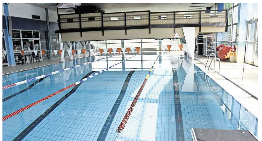
Im Wartemodus: Die Region Hannover hat noch immer keine Baugenehmigung für die lange geplante Sanierung des Pattenser Bades erteilt.

Die Kämmerin könne sich nicht auf ein konkretes Datum für den Baubeginn festlegen.