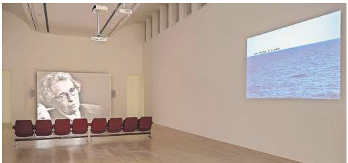
Die Kestner Gesellschaft widmet sich in einer Ausstellung dem Wirken von Hannah Arendt.