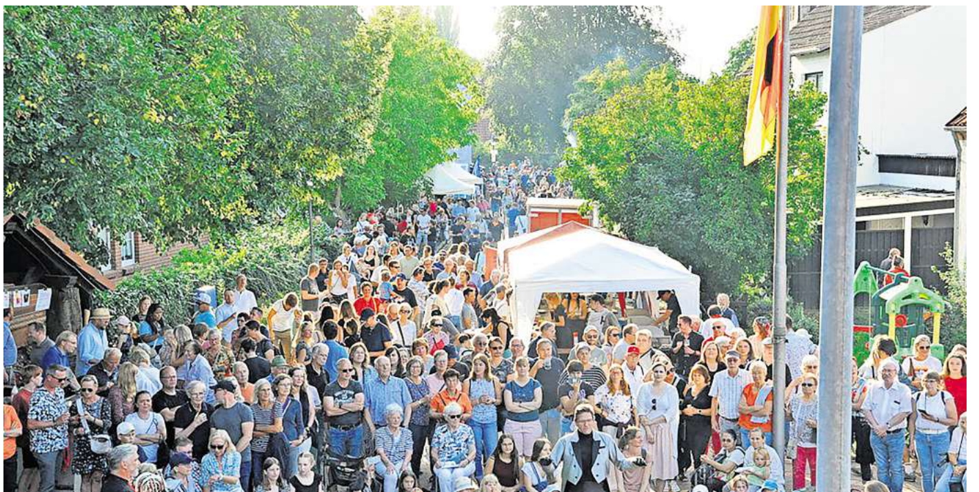
Gute Laune beim Brunnenfest: Mit einem abwechslungsreichen Programm feierten 4500 Besucher 2023 in Grasdorf.

Partner im RedaktionsNetzwerk Deutschland