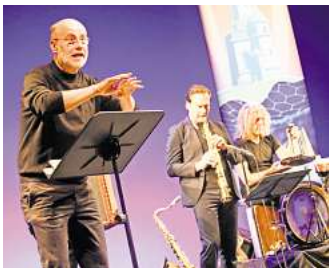
Vortrag mit Harald Lesch

Das Vortrags- und Konzertprogramm, für das Gäste vorab kostenlose Tickets reservieren müssen, wird eröffnet am 23. September ab 20 Uhr im Theater am Aegi, wo der bekannte Astrophysiker und Fernsehmoderator Professor Dr. Harald Lesch „Sonne, Mond und Sterne“ bespricht. Von der Entstehung unseres Sonnensystems, das uns