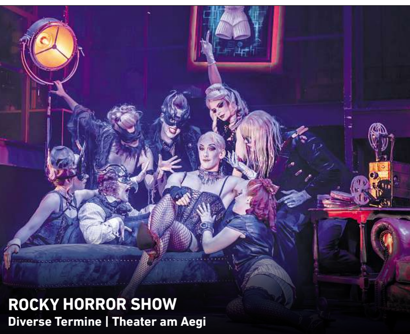
ROCKY HORROR SHOW Diverse Termine | Theater am Aegi

Ihr persönlicher Ticketservice der HAZ & NP