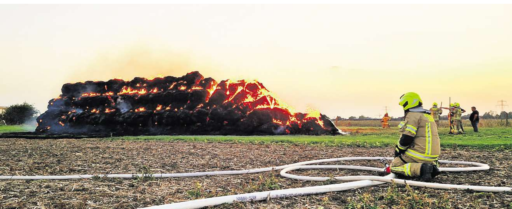
Großbrand: 120 Strohballen östlich von Gleidingen stehen in Flammen.

Im Nachgang wurden zusätzlich die Ortsfeuerwehren Rethe und Ingeln-Oesselse alarmiert. Insgesamt waren sechs Löschfahrzeuge und etwa 60