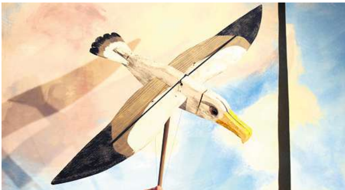
Das Figurentheater Marmelock zeigt sein neues Stück „Keentied oder die Kunst ins Glück zu fliegen“.