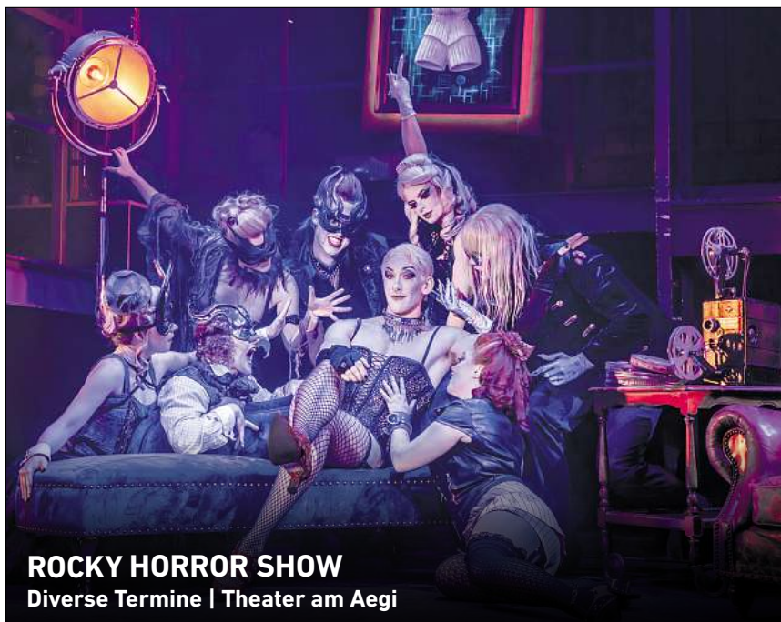
ROCKY HORROR SHOW Diverse Termine | Theater am Aegi

In den HAZ & NP Geschäftsstellen Hannover, Lange Laube 10 Neustadt, Am Wallhof 1 Burgdorf, Marktstraße 16 Langenhagen, im CCL, Marktplatz 5 Theater am Aegi, Aegidientorplatz 2