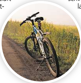
Mit dem Fahrrad unterwegs: Zum Aktionstag lassen sich Stadt und Natur unter neuen Blickwinkeln erkunden.

➤ Bei einem historisch-botanischen Spaziergang wird ab 16 Uhr der 120 Jahre alte Maschpark mit dem Fokus auf den Klimawandel erkundet. Dabei ist zu erfahren, wie aus einer überschwemmten Wiesenlandschaft eine gut besuchte Parklandschaft entstand und warum Rathaus und Maschpark dort wurden. Mit historischen Fotos und Plänen wird die Entwicklung des Parkdenkmals verdeutlicht. Dabei wird auch erläutert, welche Anpassungen durch den Klimawandel im Park umgesetzt wurden. Eine Anmeldung per E-Mail an 67.umweltkommunikation@hannover-stadt.de ist erforderlich. Dann wird auch der Treffpunkt bekannt gegeben.