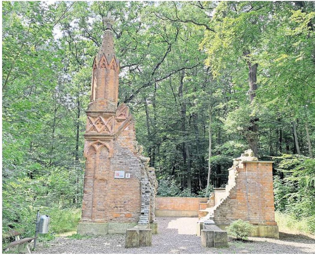
Das Mausoleum in Hemmingen: Es war die Ruhestätte für General Graf Carl von Alten.

Fünf Stationen entlang des Landwirtschaftspfads führen durch die Natur