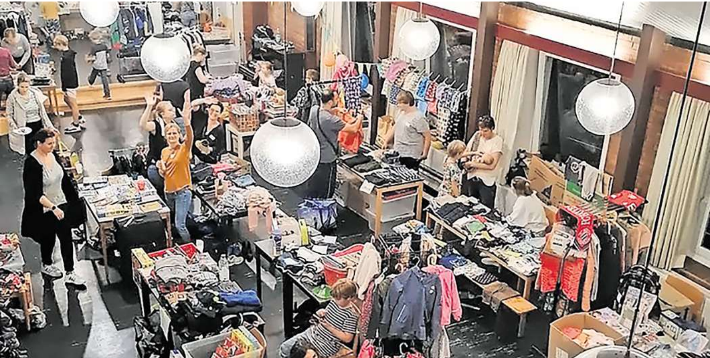
Zeit zum Stöbern: Vier Basare und Flohmärkte finden allein im September in Hemmingen statt.

Terminüberblick über die nächsten Veranstaltungen im Stadtgebiet von Hemmingen