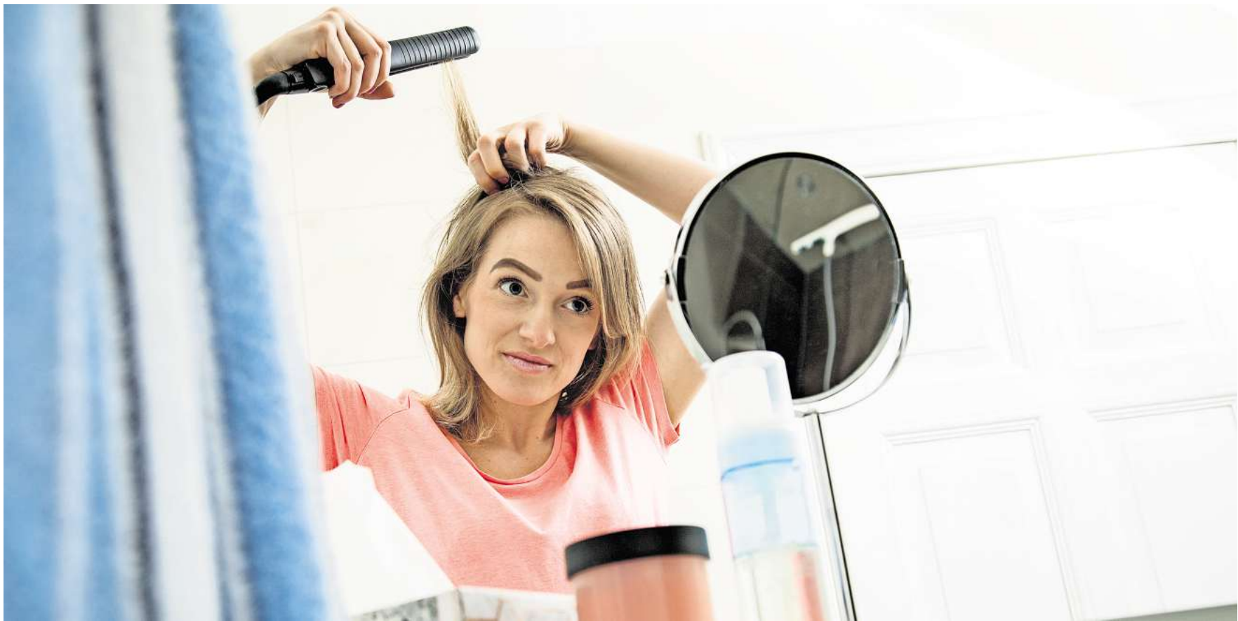
Nervige Dreher: Mit einem Glätteisen kann man nur wenig gegen Haarwirbel ausrichten.