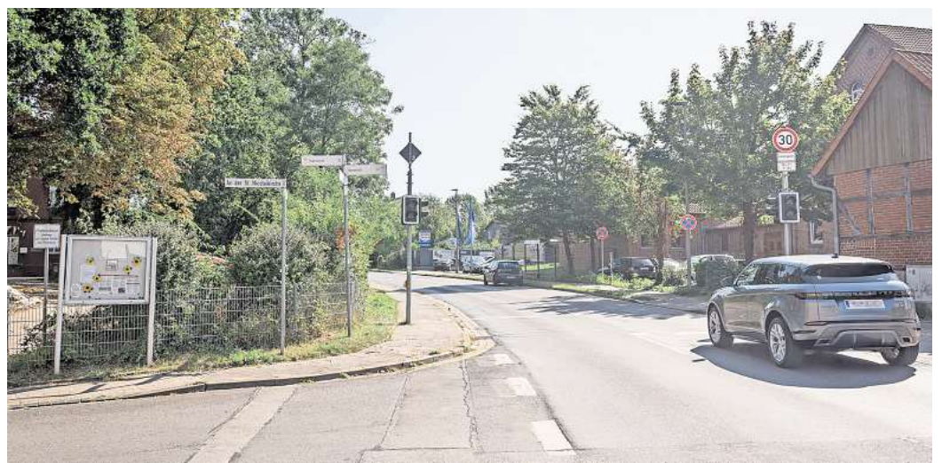
Aufgrund einer Baustelle wird die Gleidinger Straße in Oesselse einspurig. Auf dem Gehweg sollen neue Bodenleitsysteme eingebaut werden.