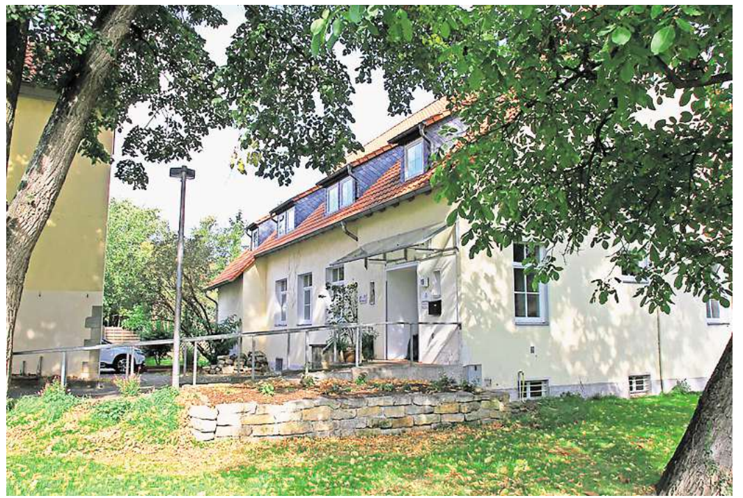
Hochwassersicher: Die oberirdischen Räume des an der Bruchriede gelegenen Gemeindehauses der St.-Petri-Kirche in Rethen sollen zum Jugendzentrum werden.