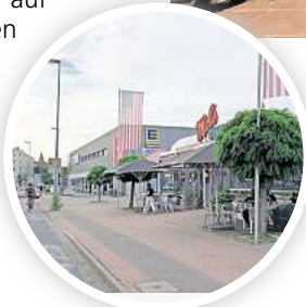
Hier zahlen Gäste noch ausschließlich in bar: Das Mel’s Diner in Alt-Laatzen.

Der Hinweis „Keine Kartenzahlung möglich“ steht vielfach auf Schildern, auf den Speisekarten und auch direkt am Tresen des „Wiesendachhauses“. Trotzdem kommt es immer wieder vor, dass Gäste nach der Bestellung ihre Bankkarte zücken und auf das Lesegerät warten. So wie jüngst ein Radfahrer aus Döhren. „Ich hatte es nicht mehr auf dem Schirm, dass es hier nur Barzahlung gibt“, sagt der Mann. Sein Kumpel hatte aber Geld dabei und übernahm die Rechnung.