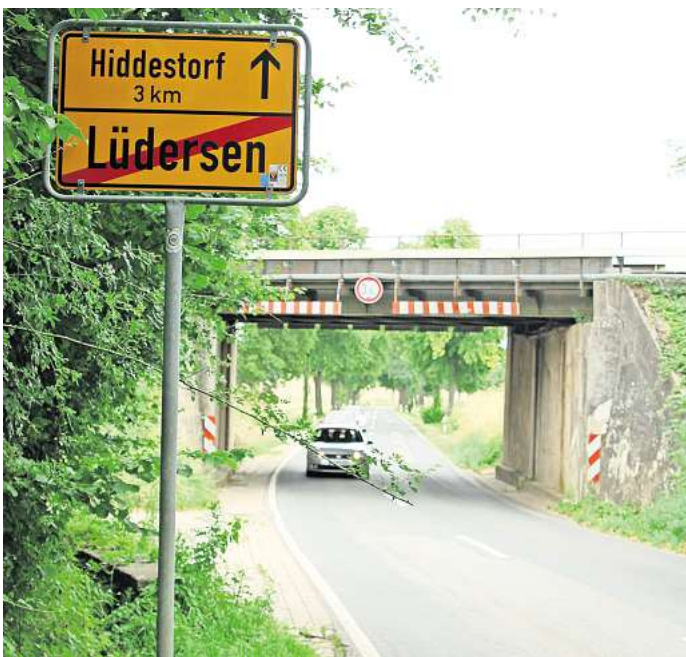
Radweg nach Hiddestorf: Unter der Bahnbrücke bei Lüdersen ist zu wenig Platz.

Die größte Chance auf eine zeitnahe Umsetzung hätte laut Baatzsch ein Bürgerradweg. Das bedeutet: Die Anwohner der Orte sowie die Kommunen und Regionen planen, das Land als Baustütze der Straße übernehmen aber die meisten Kosten.