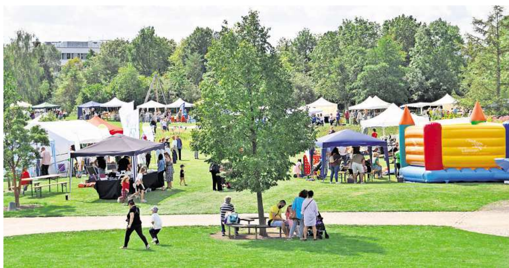
Ein Fest der Sinne findet vom 16. bis 18. August im Park der Sinne statt.

► Dienstag, 6. August, 18 Uhr: Jugendliche von St. Petri und die AWO Rethen-Koldingen-Reden helfen bei der Smart-