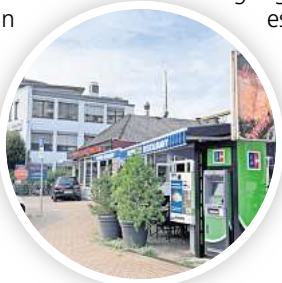
Geldautomat beim Restaurant: Beim Bosporus an der Hildesheimer Straße in Alt-Laatzen steht seit Anfang des Jahres ein EC-Automat des Unternehmens CashZone aus Irland.

Anders als in skandinavischen Ländern, wo Gäste und Kunden fast ausnahmslos elektronisch Einkäufe tätigen, steht das Bargeld in Deutschland noch hoch im Kurs. Doch der in der Corona-Zeit verstärkte Trend weg von Scheinen und Münzen hin zum Shoppen mit Karte, Smartphone oder Uhr setzt sich auch hierzulande ungebremsst fort. Einer Studie der Bundesbank mit rund 5700 Befragten ergab, dass 2023 fast jeder zweite Einkauf (49 Prozent) in bar getätigt wurde. Bei der vorherigen Befragung im Jahr 2021 waren es noch 42 Prozent gewesen. Vor allem jüngere Menschen nutzen Alternativen zum Bargeld.