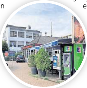
Geldautomat beim Restaurant: Beim Bosporus an der Hildesheimer Straße in Alt-Laatzen steht seit Anfang des Jahres ein EC-Automat des Unternehmens CashZone aus Irland.

Anders als in skandinavischen Ländern, wo Gäste und Kunden fast ausnahmslos elektronisch Einkäufe tätigen, steht das Bargeld in Deutschland noch hoch im Kurs. Doch der in der Corona-Zeit verstärkte Trend weg von Scheinen und Münzen hin zum Shoppen mit Karte, Smartphone oder Uhr setzt sich auch hierzulande ungebremsst fort. Einer Studie der Bundesbank mit rund 5700 Befragten ergab, dass 2023 fast jeder zweite Einkauf (49 Prozent) in bar getätigt wurde. Bei der vorherigen Befragung im Jahr 2021 waren es noch 42 Prozent gewesen. Vor allem jüngere Menschen nutzen Alternativen zum Bargeld.