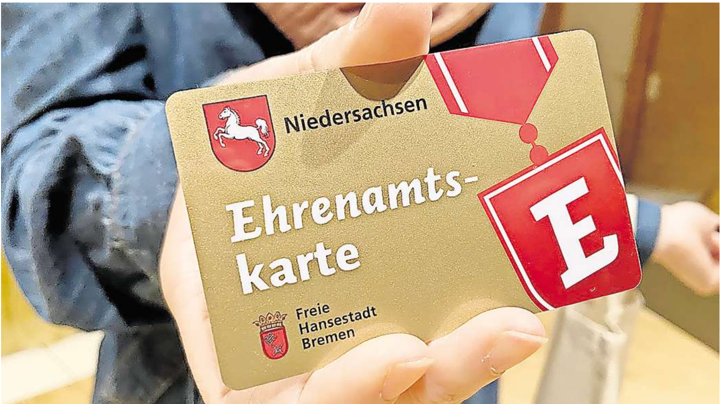
So sieht sie aus: Die Inhaber der goldenen Ehrenamtskarte bekommen viele Vergünstigungen.

18 Jahre alt sein und aus Pattensen kommen. Je nach Einsatzgebiet werde womöglich auch ein Führungszeugnis und in Einzelfällen ein erweitertes Führungszeugnis benötigt, sagte Steding: „Das wird dann aber individuell abgesprochen. Die Kosten dafür übernimmt die Stadt.“ In einem erweiterten Führungszeugnis werden zusätzliche Verurteilungen von Sexualdelikten angezeigt, die in einem normalen Führungszeugnis wegen Geringfügigkeit nicht genannt werden – wenn sie zum Beispiel nur eine Geldstrafe von weniger als 90 Tagessätze umfassen. Das erweiterte Zeugnis wird häufig verlangt, wenn die ehrenamtlichen Helferinnen und Helfer in ihrem Einsatzgebiet mit Kindern und Jugendlichen Kontakt haben. Wer sich für ein freiwilliges Engagement interessiert, kann sich ab sofort beim Sozial- und Jugenddienst für die Aufnahme in den Ehrenamtspool melden. Individuelle Wünsche und Fähigkeiten würden bei den künftigen Einsätzen in den unterschiedlichen Bereichen berücksichtigt. Der zeitliche Umfang va-