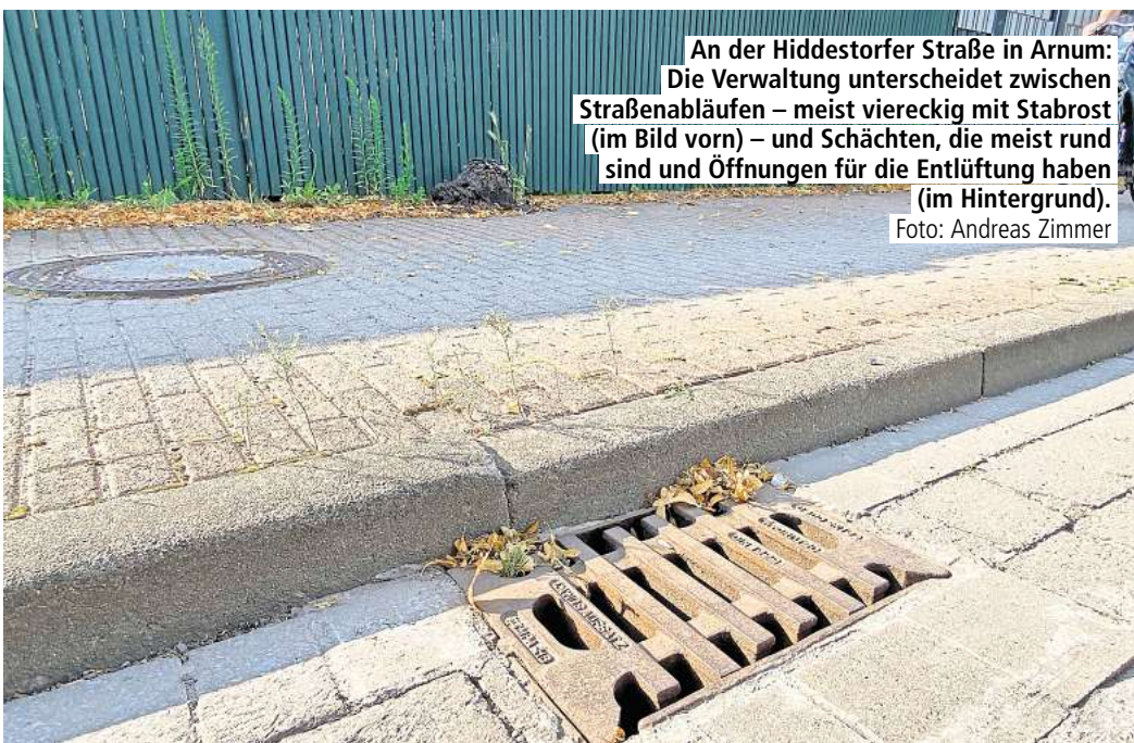
An der Hiddestorfer Straße in Arnum: Die Verwaltung unterscheidet zwischen Straßenabläufen – meist viereckig mit Stabrost (im Bild vorn) – und Schächten, die meist rund sind und Öffnungen für die Entlüftung haben (im Hintergrund).

Wasser gebe, werde „engmaschiger“ kontrolliert. „Bei diesen Kontrollen durch die Abteilung Tiefbau hat sich herausgestellt, dass mindestens 80 bis 90 Prozent der als verstopft gemeldeten Straßenabläufe lediglich einen gewissen Laub- oder Schmutzanteil im Laubeimer aufweisen, der jedoch die Entwässerungsleistung der Straßenabläufe nicht oder nur in einem ganz geringen Umfang beeinträchtigt.“ Henze betont: „Generell gilt, dass erst bei Vollfüllung der Laubeimer, also wenn der Inhalt bis unter den Stegrost reicht, die Entwässerung stark beeinträchtigt ist.“ Wenn Anwohner den Gehweg reinigen, wofür sie an öffentlichen Straßen verpflichtet sind, sollten sie kein Laub oder