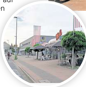
Hier zahlen Gäste noch ausschließlich in bar: Das Mel’s Diner in Alt-Laatzen.

Der Hinweis „Keine Kartenzahlung möglich“ steht vielfach auf Schildern, auf den Speisekarten und auch direkt am Tresen des „Wiesendachhauses“. Trotzdem kommt es immer wieder vor, dass Gäste nach der Bestellung ihre Bankkarte zücken und auf das Lesegerät warten. So wie jüngst ein Radfahrer aus Döhren. „Ich hatte es nicht mehr auf dem Schirm, dass es hier nur Barzahlung gibt“, sagt der Mann. Sein Kumpel hatte aber Geld dabei und übernahm die Rechnung.