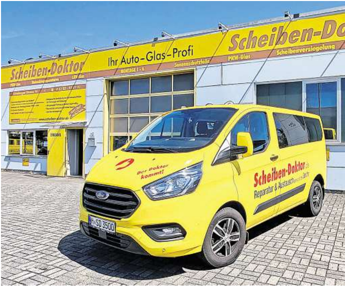
Mobil: Gegebenenfalls kann sogar der Tausch der Scheibe vor Ort beim Kunden erfolgen.

Der „Scheiben-Doktor“ Ludwig Gunkel bietet als selbstgesetzten Qualitätsanspruch zudem ein üppiges Leistungsangebot, mitsamt Neu-scheibenversiegelung und -veredelung sowie der erforderlichen Kalibrierung der Fahrerassistenz-Systeme. Denn die an der Innenseite jeder Windschutzscheibe befestigten Kameras für Abstandswarner, Spurhalteassistent oder aber die Verkehrsschilderererkennung müssen nach dem Neu-Einbau individuell kalibriert und somit neu eingestellt werden.