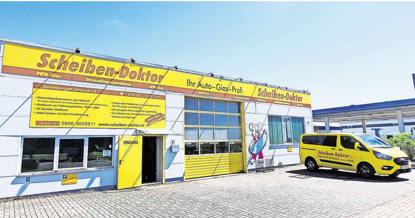
Erster Ansprechpartner für schnelle Hilfe bei Steinschlag: der Scheiben-Doktor, in Laatzen-Rethen