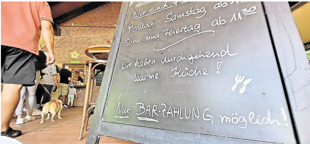
„Nur Barzahlung möglich“: Die meisten Gäste wissen, dass sie im Wiesendachhaus nicht mit Bankkarte oder gar Smartphone bezahlen können.

Die meisten wüssten Bescheid oder fänden eine Lösung, bestätigte Pächterin Elke Bostelmann. Mitunter müssten aber auch Bestellungen storniert werden. Das sei zwar für beide Seiten bedauerlich bis ärgerlich, aber aktuell nicht zu ändern. Die Internetverbindung im Landschafts-