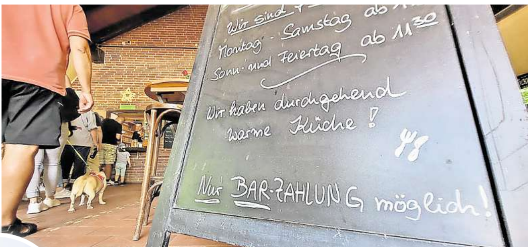
„Nur Barzahlung möglich“: Die meisten Gäste wissen, dass sie im Wiesendachhaus nicht mit Bankkarte oder gar Smartphone bezahlen können.

Die meisten wüssten Bescheid oder fänden eine Lösung, bestätigte Pächterin Elke Bostelmann. Mitunter müssten aber auch Bestellungen storniert werden. Das sei zwar für beide Seiten bedauerlich bis ärgerlich, aber aktuell nicht zu ändern. Die Internetverbindung im Landschafts-