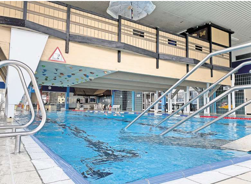
Das Pattenser Bad: Laut Energiebericht der Stadt verbraucht es unter den kommunalen Gebäuden am meisten Wärme, Strom und Wasser.