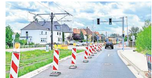
Wohl bis Ende Juli noch für Linksabbieger gesperrt.