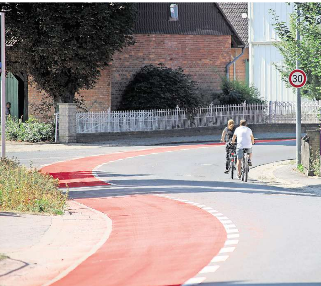
Wird extra in Rot markiert: Radfahrer in Richtung Jeinsen haben zukünftig ihre eigene Fahrspur. Die in Richtung Süden nicht.

Bei den vier Unfällen in Kernstadt waren jeweils einmal ein Lastwagen, ein Auto und ein Fußgänger beteiligt. Einmal wird auch nur ein Radfahrender als Beteiligter aufgeführt. Bei den zwei Vorkommnissen in Hüpede und dem einen in Schulenburg werden ebenfalls ausschließlich Radfahrende als Beteiligte genannt. Beim zweiten Unfall in Schulenburg war ein Auto beteiligt. In sieben Fällen notierte die Polizei leichte Verletzungen. Bei einem Radunfall auf einem Feldweg nördlich von Hüpede wurde ein Schwerverletzter aufgenommen.