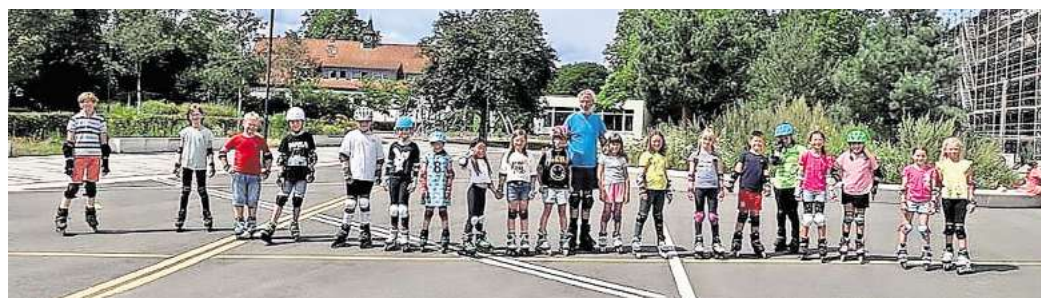
„Spiel und Spaß auf 8 Rollen“ hieß es auf dem Schulhof der KGS Hemmingen.

Der Asphalt brannte an diesem Tag nicht nur unter der Mittagssonne, die vom Himmel prallte, sondern auch unter den über 200 Rollen der teilnehmenden Inlineskaterinnen und -skater. Mit großer Begeisterung und vollem Einsatz meisterten sie verschiedene Techniken, da-