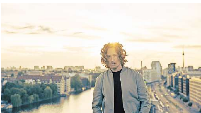
Michael Schulte steht am 27. Juli auf der Lagunenbühne.

Wir verlosen 1 x 2 Freikarten für das Konzert am 27. Juli, ab 20 Uhr. Wer gewinnen will, scannt einfach bis zum 22. Juli, 10 Uhr, nebenstehenden QR-Code, meldet sich an und dann heißt es Daumen drücken.