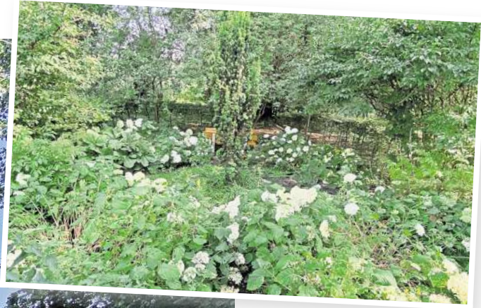
2024: So sieht es heute an gleicher Stelle in dem Grünzug aus.

zugewuchert, dass der Bach nur schwerlich zu erkennen ist. Auch auf einem kleinen Platz im Parkgebiet, früher ansehnlich bepflanzt und mit Sitzbänken versehen, muss man erst eine kleine Schneise schlagen, bis man die Bänke erreicht. Zu den Befürwortern, die sich 2017 für den Stadtpark aussprachen, gehörte der Hemminger Seniorenbeirat – auch, weil sich der Park in der Nähe des Seniorenheims befinden würde. In diesen sollte auch der Teich am Tennisplatz einbezogen werden, um einen schönen Rundweg zu schaffen. Der Beirat forderte zudem, „bewegungsanregende Geräte“ für Senioren aufzustellen.