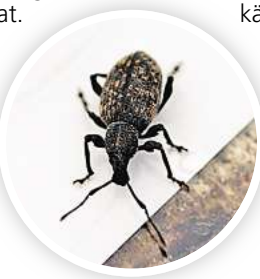
Der Dickmaulrüssler knabbert Halbkreise in die Blätter unterschiedlichster Pflanzen.

Schädlinge können Pflanzen und sogar die Ernte gefährden. Am besten begegnet man ihnen natürlich und chemiefrei, etwa mit Nematoden. Die parasitären Fadenwürmer werden mit der Gießkanne oder einem Dosiergerät verteilt. Vorab ist es gut zu wissen, mit welchem Plagegeist man es zu tun hat. Kleines Schädlingslexikon: Dickmaulrüssler: Die grauen Käfer hinterlassen runde Buchten im Laub. Den eigentlichen Schaden aber verursachen die Larven. Diese nämlich fressen an den Wurzeln und gefährden so die Pflanzen. Nematoden sind ein effektiver Gegner. Gartenlaubkäfer: Während sich der metallisch-grüne Käfer mit braunen Flügeln von Blättern und Blüten ernährt, bevorzugt