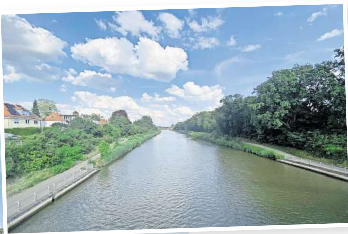
Welche Seite darf es für den Spaziergang sein? Mittellandkanal in Hannover nahe der Noltemeyerbrücke. Andreas Zimmer

bahnsteig. Wer ein- und aussteigt, muss auf entgegenkommende Fahrzeuge achten. An der St.-Nicolai-Kirche vorbei geht es auf den Bothfelder Kirchweg. Kinder werden wenige Meter weiter umgehend den Spielplatz Bothfelder Anger ansteuern. Über den Rahlfskamp und die Gernsstraße führt der Weg unter anderem vorbei an Garagen mit Tiermotiven auf den Laher Kamp und zu den Laher Wiesen, wo Dutzende Pferde weiden. Wer will, kann einen Abstecher zur Grasdachsied-