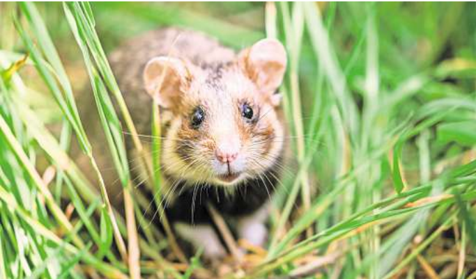
Ein Feldhamster im Gras: Die vom Aussterben bedrohte Art wird in Pattensen zum Politikum.