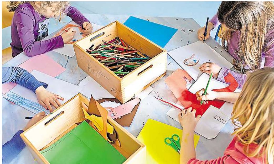
Ganztagssschule statt Hort? Bislang liegt der Schwerpunkt der Nachmittagsbetreuung bei den meisten Laatzen Grundschulen in den Hortgruppen der Kitas.

Auf Nachfrage bestätigten mehrere Schulleitungen diesen Wunsch. „Grundsätzlich ist die Überlegung, dass wir gleich mit