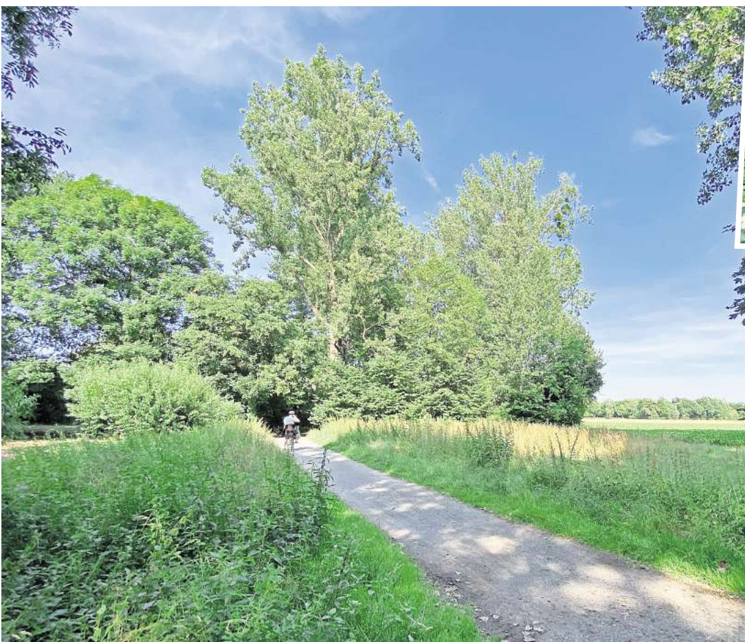
Einen Grünzug gibt es in Hemmingen-Westerfeld schon: Hieraus könnte ein Stadtpark werden.

der Weetzer Landstraße beginnen und sich am Friedhof vorbei bis in Richtung altes Dorf erstrecken – auf einer Fläche fast so groß wie 13 Fußballfelder. „Das werden keine Herrenhäuser Gärten“, stellte der damalige Fachbereichsleiter Axel Schedler klar. Das Gelände sollte in mehreren Abschnitten für die Nutzer unterschiedlicher Altersgruppen umgestaltet werden. Allerdings: „Ein paar zusätzliche Bänke machen noch keinen Stadtpark“, betonte Schedler ebenfalls. Gastronomische Angebote schloss er jedoch ebenso aus wie eine Beleuchtung durch Laternen. Der SPD-Ortsverein und die Ratsfraktion greifen nun eine Idee aus dem ISEK wieder auf: Sie