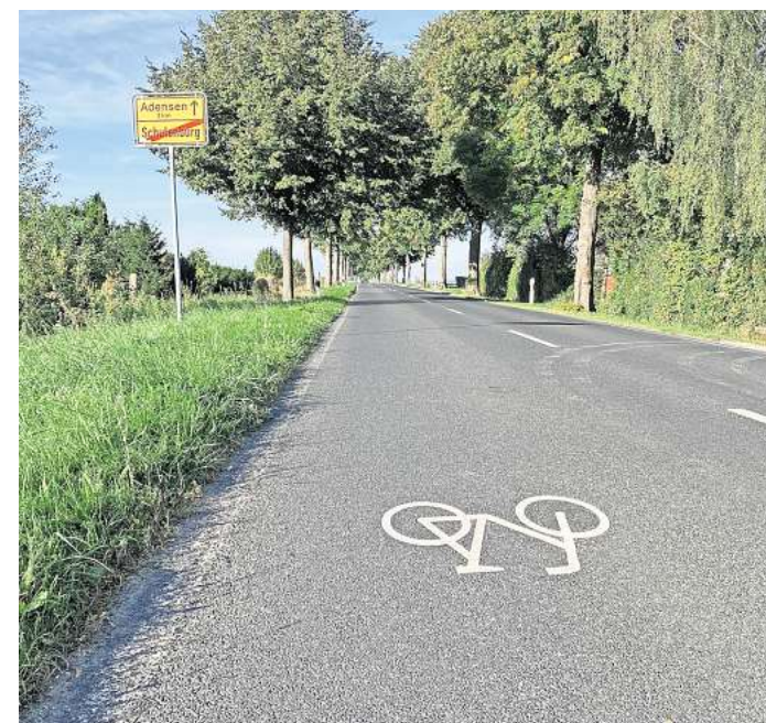
Geplanter Radweg: Die Region Hannover kündigt an, einen Fahrradweg neben der Kreisstraße 204 zwischen Schulenburgs Ortsausgang und Bundesstraße 3 zu bauen. Radweg Schulenburg Pattensen

Für Radfahrerinnen und Radfahrer wäre das attraktiv, sagte ein Planer der Region Hannover bereits im vergangenen Jahr. Doch die endgültige Entscheidung soll jetzt erst fallen.