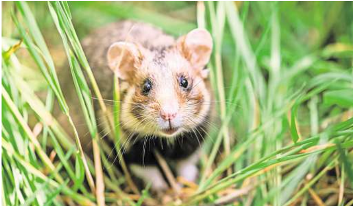
Ein Feldhamster im Gras: Die vom Aussterben bedrohte Art wird in Pattensen zum Politikum.