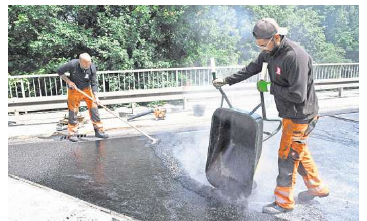
Bis zum Ende der Sommerferien nur vom Linienbus passierbar: Auf der Brücke der Erich-Panitz-Straße über die B443 und an ihren beiden Rampen wird noch bis Anfang August der Straßenbelag erneuert. -

auch im Umfeld erfolgen bis Anfang August noch Straßenbauarbeiten. Denn auch die beiden Rampen zur Brücke weisen provisorisch geflickte Risse im Belag