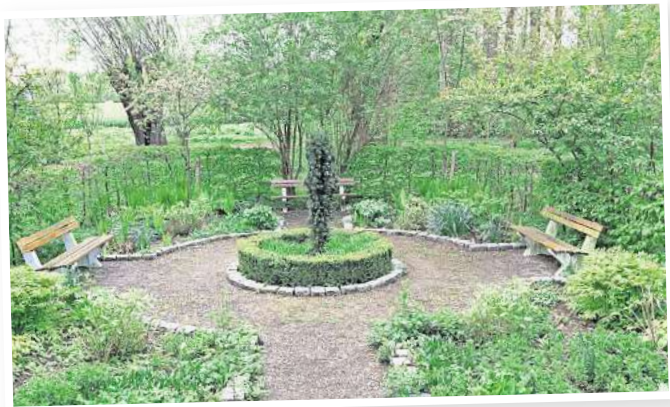
Eine Grundlage für den möglichen Stadtpark: So sah es 2017 in einem Teil des bereits bestehenden Grünzugs aus.

zugewuchert, dass der Bach nur schwerlich zu erkennen ist. Auch auf einem kleinen Platz im Parkgebiet, früher ansehnlich bepflanzt und mit Sitzbänken versehen, muss man erst eine kleine Schneise schlagen, bis man die Bänke erreicht. Zu den Befürwortern, die sich 2017 für den Stadtpark aussprachen, gehörte der Hemminger Seniorenbeirat – auch, weil sich der Park in der Nähe des Seniorenheims befinden würde. In diesen sollte auch der Teich am Tennisplatz einbezogen werden, um einen schönen Rundweg zu schaffen. Der Beirat forderte zudem, „bewegungsanregende Geräte“ für Senioren aufzustellen.