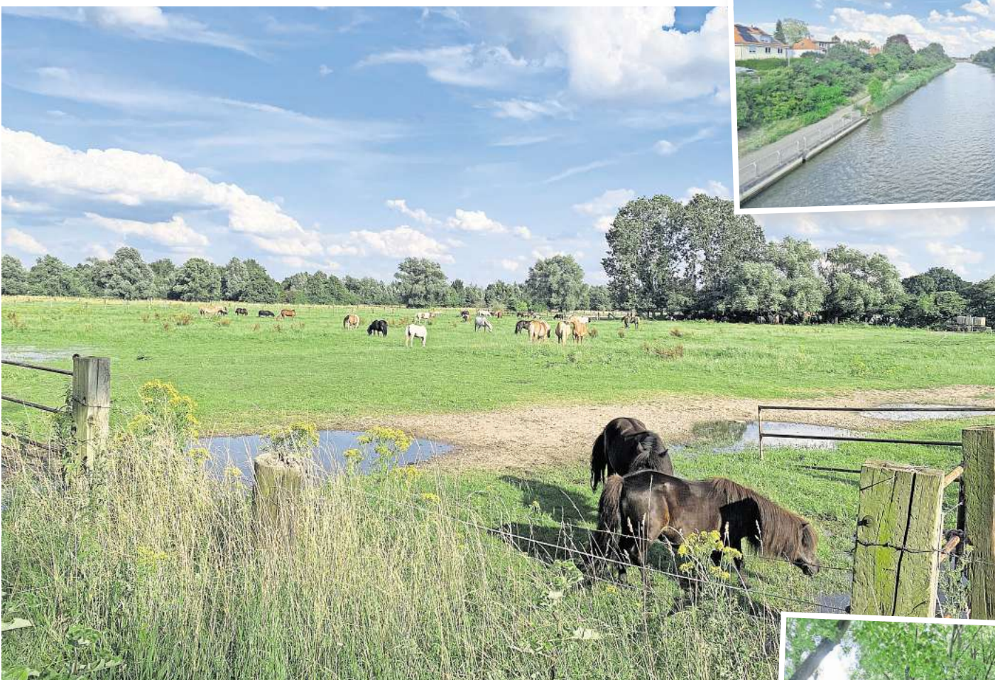
Idyllisches Fleckchen: die Laher Wiesen.

► Wo aussteigen? Bahnhof Linden/Fischerhof ► Wie lange dauert die reguläre Fahrtzeit von Hemmingen Endpunkt? Sie beträgt 17 Minuten. ► Was gibt es zu sehen? Wer den Bahnhof in Richtung Stammeistraße verlässt, kann über den Ohedamm direkt in Richtung Maschsee laufen. Dort befindet sich die Anlegestelle Westanleger/Fährhaus, und der See lässt sich wunderbar vom Boot aus erkunden. In der Hauptsaison bis zum 15. September fahren die Boote täglich von 10 bis 18 Uhr. Vom Fährhaus sind es nur etwa zehn Minuten bis zum sogenannten Zauberswald, einer Kunstgalerie unter freiem Himmel. Am Maschsee ist meist etwas los, aber besonders maritim wird es beim Maschseefest vom 31. Juli bis 18. August, Deutschlands größtem Seefest. ► Wo aussteigen? Lister Platz ► Wie lange dauert die reguläre Fahrtzeit von Hemmingen Endpunkt? In 21 Minuten ist der Lister Platz erreicht. ► Was gibt es zu sehen? Shopping und Gastronomie locken an der Lister Meile und nach mehrjähriger Pause vom 30. August bis 1. September auch wieder das beliebte Lister-Meile-Fest. Vom Lister Platz ist man in wenigen Minuten am Lister Turm, wo viele Veranstaltungen angeboten werden und wo sich ein idyllischer Biergarten befindet. Die angrenzende Eilenriede gehört zu den größten Stadtwäldern Europas. Wer mit Kindern unterwegs ist, für den ist ein Besuch bei Wakitu – ganz in der Nähe des Lister Turms – ein Muss. Die Abkürzung steht für Waldkindertummelplatz – vor mehr als 125 Jahren war das Hannovers erste Spielplatz.