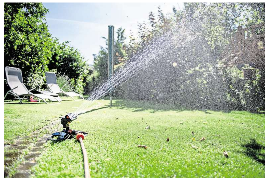
Der Rasensprenger muss den ganzen Tag laufen. Die beste Zeit ist abends.

► Düngung: Für einen gesunden Rasen ist eine ausgewogene Nährstoffzufuhr wichtig. Rund