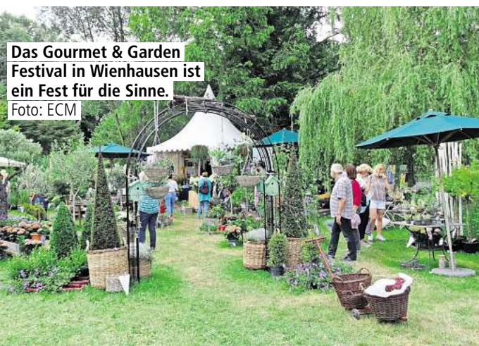
Das Gourmet & Garden Festival in Wienhausen ist ein Fest für die Sinne.