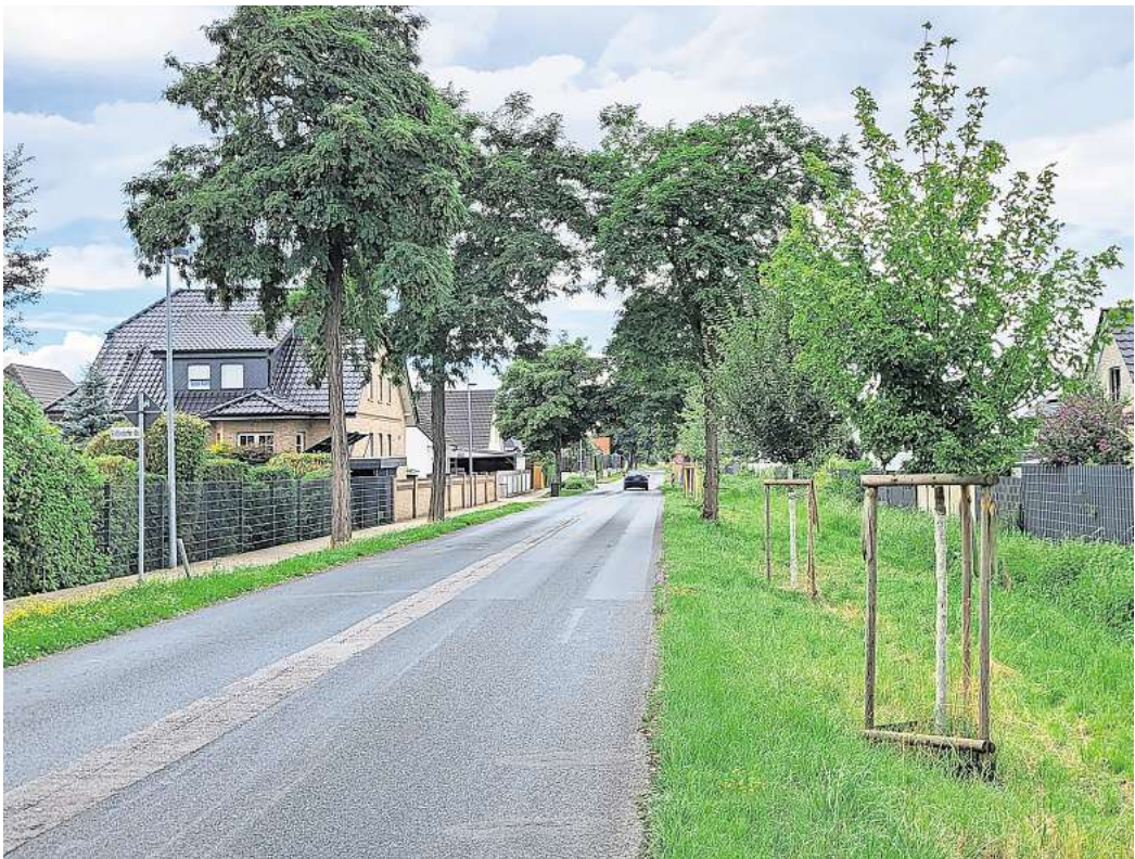
Im Moment noch Grünfläche: Auf der Hiddestorfer Straße soll in Richtung Stadtausgang ein Radweg angelegt werden.

Dieser soll 2,5 Meter breit sein und an den Seiten jeweils noch 0,5 Meter breite Streifen bekommen, über die auch die Entwässerung des Wegs in die angrenzenden Mulden und den Straßengraben laufen soll. Die Anlage einer Überquerung der Hiddestorfer Straße ist nicht geplant. Die Straße sei gut einsehbar, heißt es. Eine Überquerung für Fußgängerinnen und Fußgänger sowie Radfahrende wird empfohlen, wenn bei Tempo 50 rund 1000 Fahrzeuge pro Stunde auf der Straße unterwegs sind. Diese Zahl soll hier bei Weitem nicht erreicht werden.