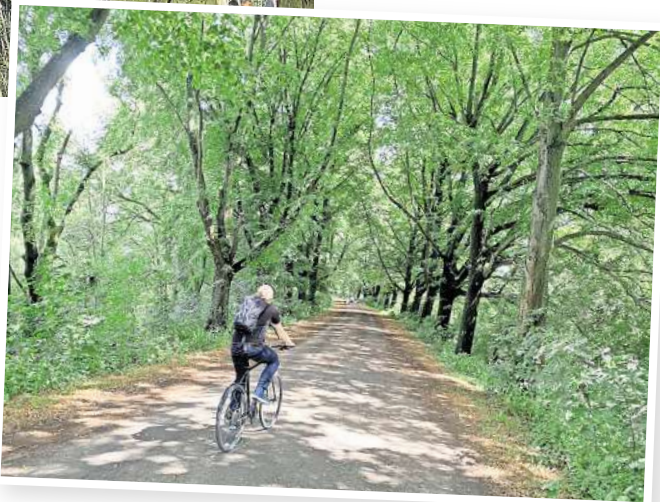
Schöne Verbindung zwischen dem Bahnhof Linden/Fischerhof und dem Maschsee: der Ohedamm. Andreas Zimmer

lung Laher Wiesen machen. Die 1984 und 1985 entstand und europaweit als visionäres Bauprojekt galt. Bothfeld besteht seit 750 Jahren. Das große Jubiläumsfest war zwar bereits im Juni, aber es gibt noch weitere interessante Veranstaltungen wie das Summer-Dance-Festival der Tanzschule Bothe am 17. und 18. August sowie den Herbstmarkt am 21. September.