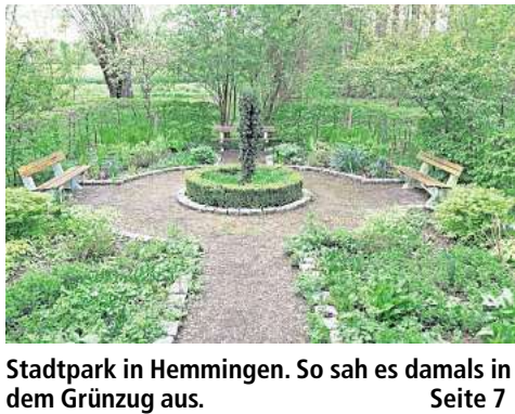
Stadtspark in Hemmingen. So sah es damals in dem Grünzug aus. Seite 7