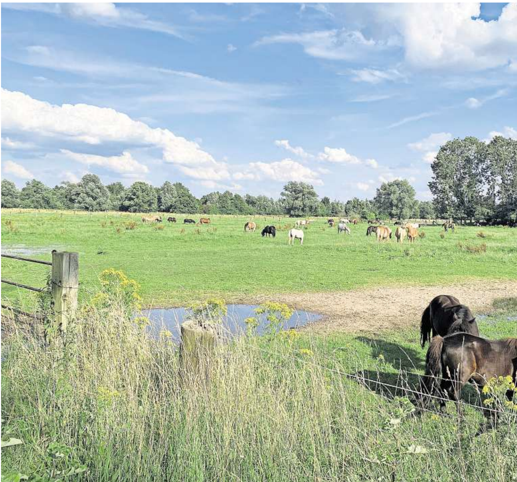
Idyllisches Fleckchen: die Laher Wiesen.

► Wo aussteigen? Bahnhof Linden/Fischerhof ► Wie lange dauert die reguläre Fahrtzeit von Hemmingen Endpunkt? Sie beträgt 17 Minuten. ► Was gibt es zu sehen? Wer den Bahnhof in Richtung Stamestraße verlässt, kann über den Ohedamm direkt in Richtung Maschsee laufen. Dort befindet sich die Anlegestelle Westanleger/Fährhaus, und der See lässt sich wunderbar vom Boot aus erkunden. In der Hauptsaison bis zum 15. September fahren die Boote täglich von 10 bis 18 Uhr. Vom Fährhaus sind es nur etwa zehn Minuten bis zum sogenannten Zauberswald, einer Kunstgalerie unter freiem Himmel. Am Maschsee ist meist etwas los, aber besonders maritim wird es beim Maschseefest vom 31. Juli bis 18. August, Deutschlands größtem Seefest. ► Wo aussteigen? Lister Platz ► Wie lange dauert die reguläre Fahrtzeit von Hemmingen Endpunkt? In 21 Minuten ist der Lister Platz erreicht. ► Was gibt es zu sehen? Shopping und Gastronomie locken an der Lister Meile und nach mehrjähriger Pause vom 30. August bis 1. September auch wieder das beliebte Lister-Meile-Fest. Vom Lister Platz ist man in wenigen Minuten am Lister Turm, wo viele Veranstaltungen angeboten werden und wo sich ein idyllischer Biergarten befindet. Die angrenzende Eilenriede gehört zu den größten Stadtwäldern Europas. Wer mit Kindern unterwegs ist, für den ist ein Besuch bei Wakitu – ganz in der Nähe des Lister Turms – ein Muss. Die Abkürzung steht für Waldkindertummelplatz – vor mehr als 125 Jahren war das Hannovers erste Spielplatz.