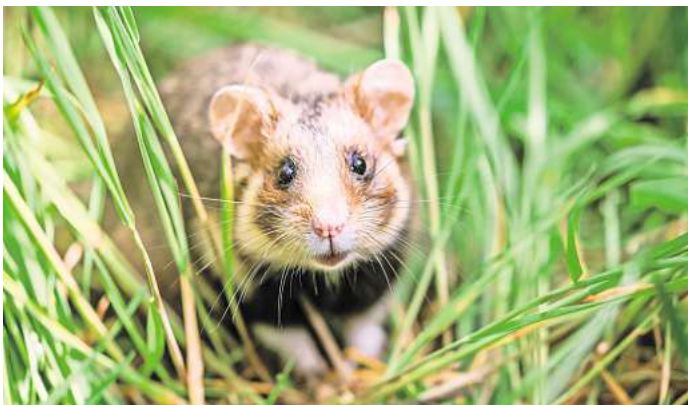
Ein Feldhamster im Gras: Die vom Aussterben bedrohte Art wird in Pattensen zum Politikum.