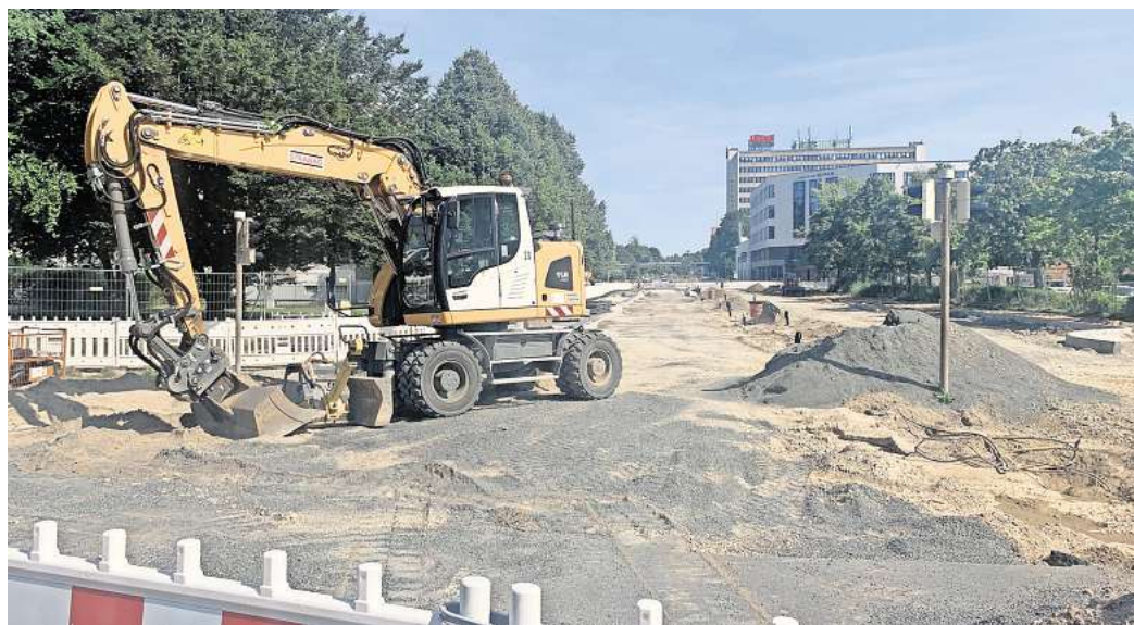
Autofahrer in Laatzen-Mitte müssen sich weiter in Geduld üben. Die seit April bestehende Vollsperrung der Marktstraße im nördlichen Abschnitt dauert deutlich länger als zunächst von der Stadt angekündigt. Es habe sich um ein Missverständnis gehandelt, so eine Stadtsprecherin.

Im August beginnt der Umbau der Ampelkreuzung der Markt- und Gutenbergstraße sowie der Würzburger Straße zum Kreisell. Über die dann veränderte Verkehrsführung will die Stadt Laatzen rechtzeitig informieren.