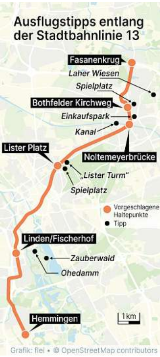
Stadtbahnlinie 13, Hemmingen Fasanenkrug Hannover, Ausflugstipps Grafik: flei / OpenStreetMap contributors

HEMMINGEN. Der erste Sommer in Hemmingen mit der Stadtbahnlinie 13 vor der Haustür: Das nimmt die Redaktion zum Anlass, einige Kurzausflüge mit Zielen vorzustellen, die ab dem Endpunkt in Hemmingen-Westerfeld ohne weiteres Umsteigen in bis zu rund 30 Minuten zu erreichen sind. Wer mag, geht einfach die empfohlene Route wieder zur jeweiligen Station zurück oder erweitert die Tour nach eigenen Wünschen und steigt dann dort in eine andere Stadtbahn oder in einen Bus ein. Fahrplanauskünfte sind im Internet auf uestra.de abzurufen.