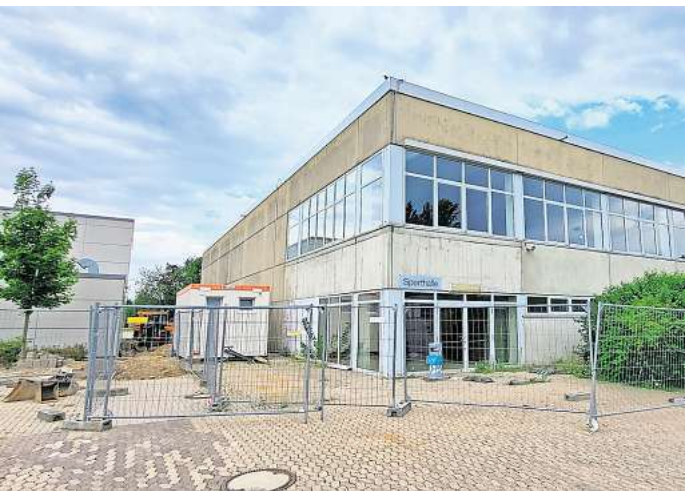
Sporthalle der KGS Pattensen: Die Sanierung dauert noch bis 2025.

Trotz voller Auftragsbücher in vielen Handwerksbetrieben habe es keine Probleme mit der Vergabe der einzelnen Gewerke gegeben. „Das ist gut gelaufen“, sagte Müller. Die Verzögerung seit mit der Schulleitung abgestimmt. Fast alle Sportstunden können vorübergehend auch in der Einfeldhalle organisiert werden.