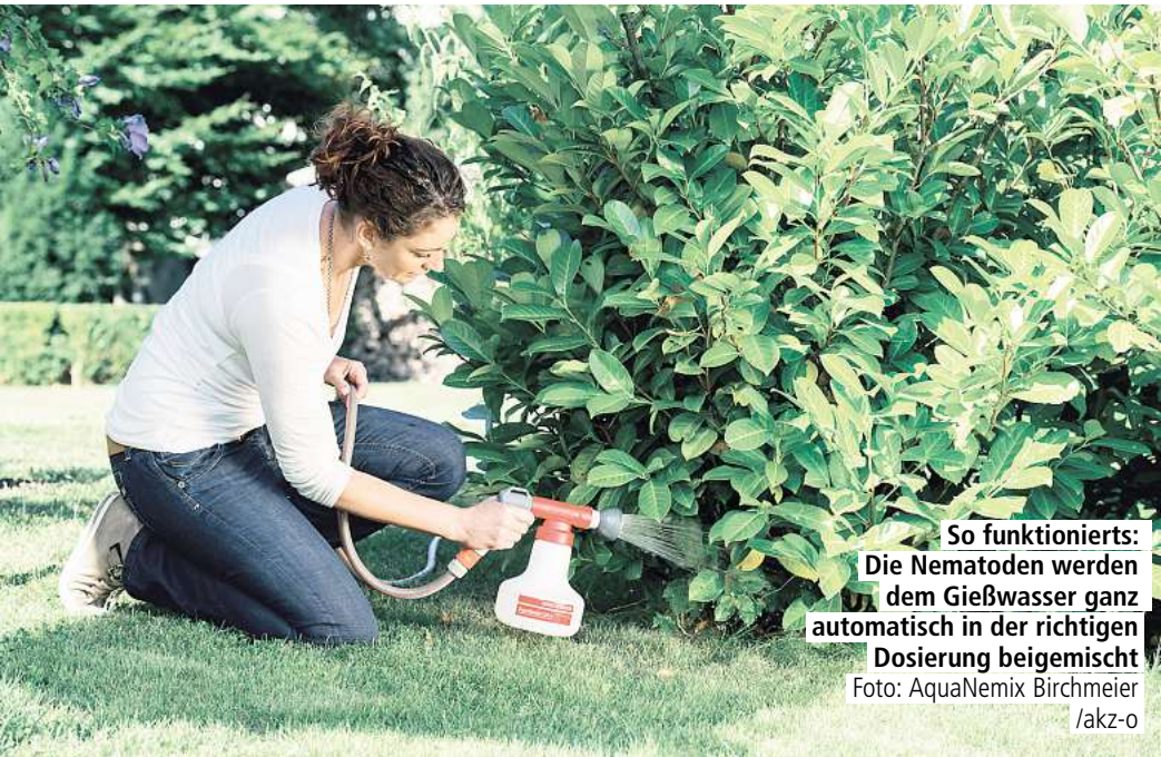
So funktioniert: Die Nematoden werden dem Gießwasser ganz automatisch in der richtigen Dosierung beigegeben.

Schädlinge können Pflanzen und sogar die Ernte gefährden. Am besten begegnet man ihnen natürlich und chemiefrei, etwa mit Nematoden. Die parasitären Fadenwürmer werden mit der Gießkanne oder einem Dosiergerät verteilt. Vorab ist es gut zu wissen, mit welchem Plagegeist man es zu tun hat. Kleines Schädlingslexikon: Dickmaulrüssler: Die grauen Käfer hinterlassen runde Buchten im Laub. Den eigentlichen Schaden aber verursachen die Larven. Diese nämlich fressen an den Wurzeln und gefährden so die Pflanzen. Nematoden sind ein effektiver Gegner. Gartenlaubkäfer: Während sich der metallisch-grüne Käfer mit braunen Flügeln von Blättern und Blüten ernährt, bevorzugt