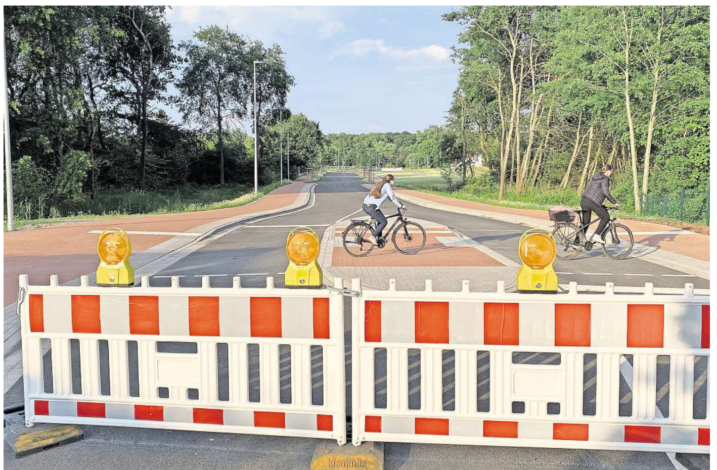
Die Absperrbaken bleiben noch eine Weile: das verlängerte Stück der Alfred-Bentz-Straße.

Der etwa 250 Meter lange Straßenabschnitt verbindet das Gewerbegebiet Devese mit der Göttinger Landstraße, also der alten Bundesstraße 3. Die gesamte Strecke soll die Weetzer Landstraße entlasten, die durch Hemmingen-Westerfeld und Devese führt. Sie ist im Hemminger Stadtgebiet die Straße mit dem meisten Verkehr nach der B3-Umgehung.