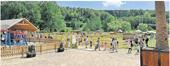
Charles KniesCircus-Land ist längst kein Geheimtipp mehr.

Das Circus-Land ist bis 31. August in der Regel Dienstag bis Sonntag von 10 bis 18 Uhr und im September an den Wochenenden geöffnet. Alle Infos zu Öffnungstagen und Ticketverkauf gibt es unter www.circus-land.de und unter der Hotline 0171 / 946 24 56.