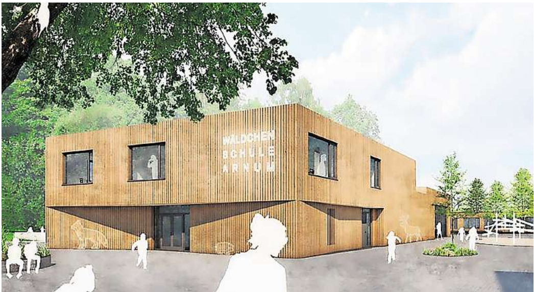
Wird teurer als geplant: der Neubau an der Grundschule in Arnum. Visualisierung: Pfitzner Moorchens Architekten

Elisabeth Seiler (Grüne) sieht die Möglichkeit für kleinere Einsparungen noch darin, dass Eltern bestimmte Arbeiten übernehmen. So sollen zum Beispiel im Zuge des Projekts auch alle Klassenräume der Schule neu gestrichen werden. Dafür müsse aus Seilers Sicht nicht zwingend eine Fachfirma beauftragt werden. Auch sie habe bereits Klassenräume gestrichen und damit gute Erfahrungen gemacht. „Wir müssen die Eltern mehr in die Pflicht nehmen. Wenn wir sie ansprechen und ihnen die Situation schildern, sind viele auch bereit zu helfen“, sagte Seiler.