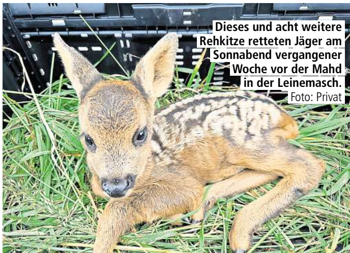
Dieses und acht weitere Rehkitze retteten Jäger am Sonnabend vergangener Woche vor der Mahd in der Leinemasch.