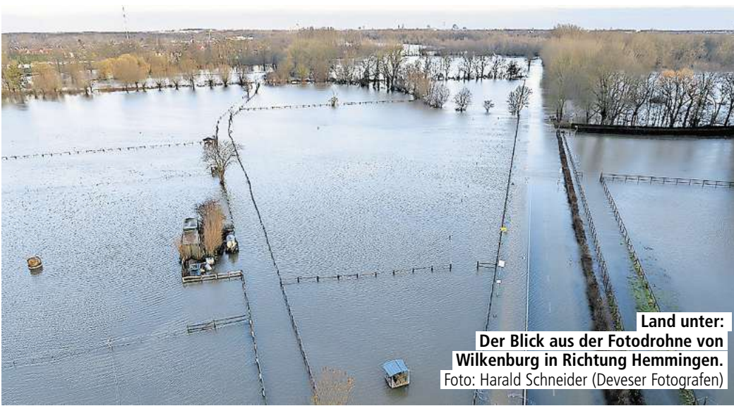
Land unter: Der Blick aus der Fotodrohne von Wilkenburg in Richtung Hemmingen.

Rückblende: Für den bestmöglichen Schutz – die sogenannte HQ100-Variante für den Fall eines Hochwassers, wie es