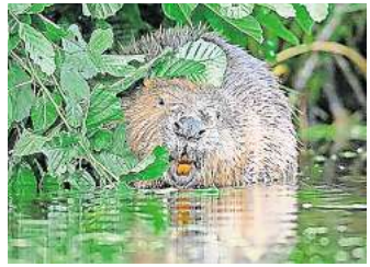
Auf Erkundungstour