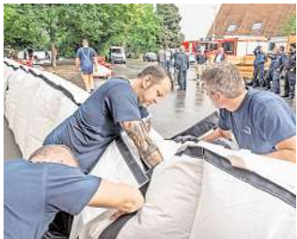
Mit mobilen Deichen gegen die Fluten