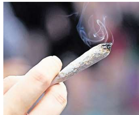
Jointes sind beim Sommerfest in Hemminger unerwünscht: Die Stadt hat Cannabisverbot für die Veranstaltung am 17. und 18. August auf dem Rathausplatz ausgesprochen.

Zu den Höhepunkten des Sommerfestes in Hemmingen zählen eine Schlagerdisco, die von der Tanzschule Teichert und dem Verein Hemmingway organisiert wird. Für die Livemusik sorgen am Sonnabend die Pop-Rock-Band „Deep Passion“ und am Sonntag die Rockband „Charly & The Labs“.