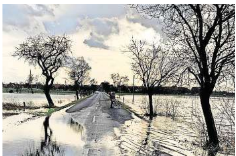
Land unter: Jetzt fordert die IG Hochwasserschutz eine neue Deichdebatte. Seite 6