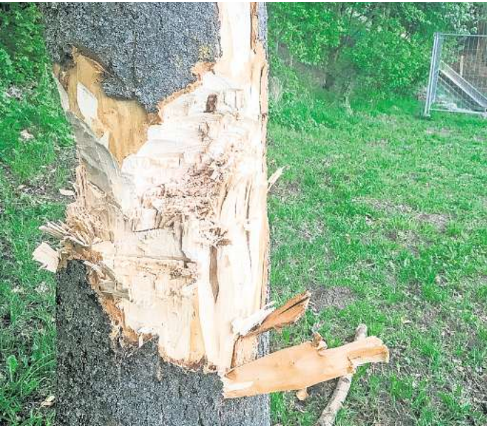
Spuren einer Axt oder Machete: Im April wurde auf diese Esche neben der Riesenrutsche am Grasdorfer Rodelberg mit einem scharfen Werkzeug eingeschlagen.

Der jüngste Baumfrevel ereignete sich Mitte Mai, in der Nacht zu Pfingstmontag, am Weg beim Grasdorfer Storchennest. Dort fiel ein Walnussbaum dem Baumfrevler zum Opfer.