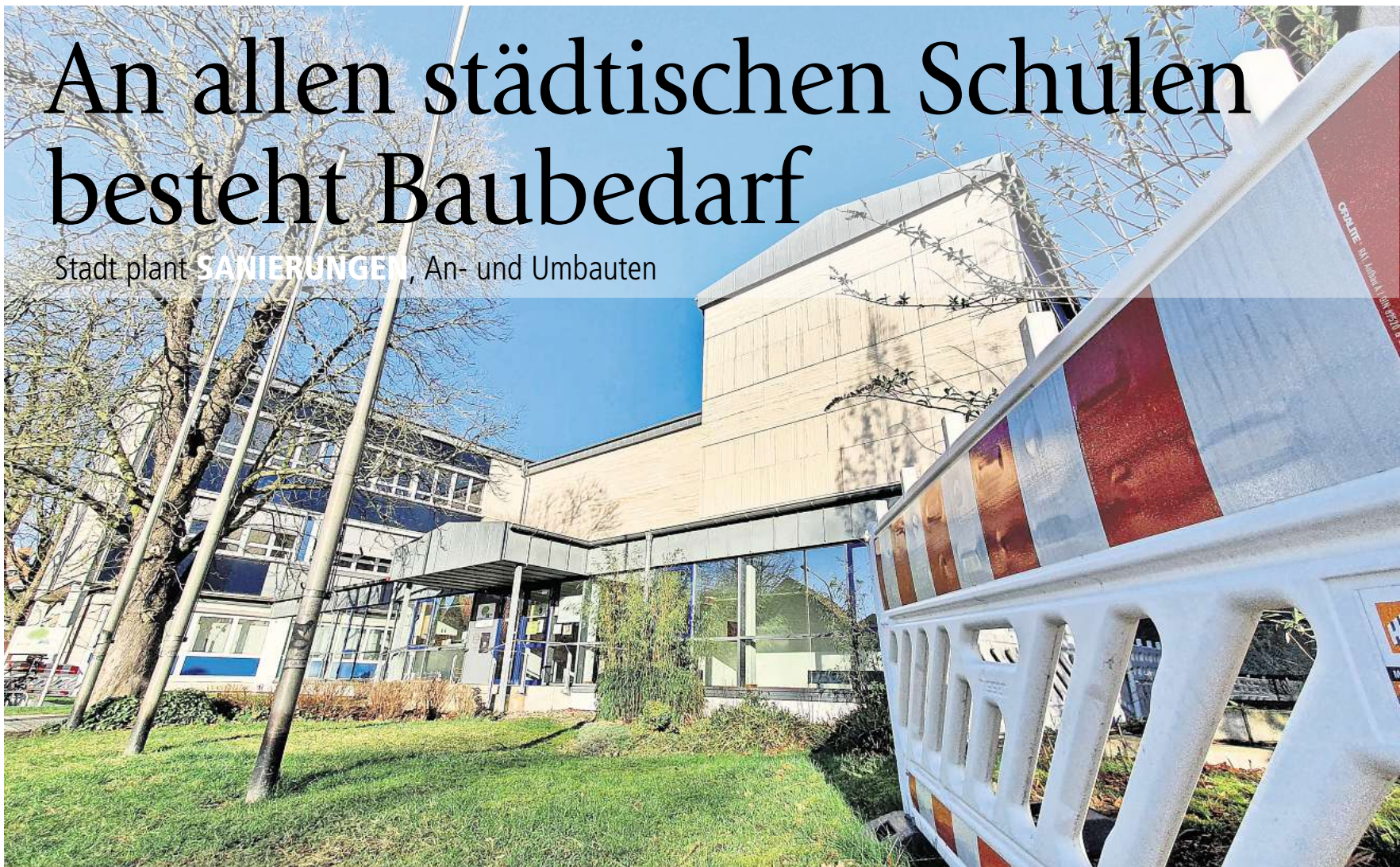
An der Grundschule Rathausstraße in Alt-Laatzen muss die Fassade saniert werden.