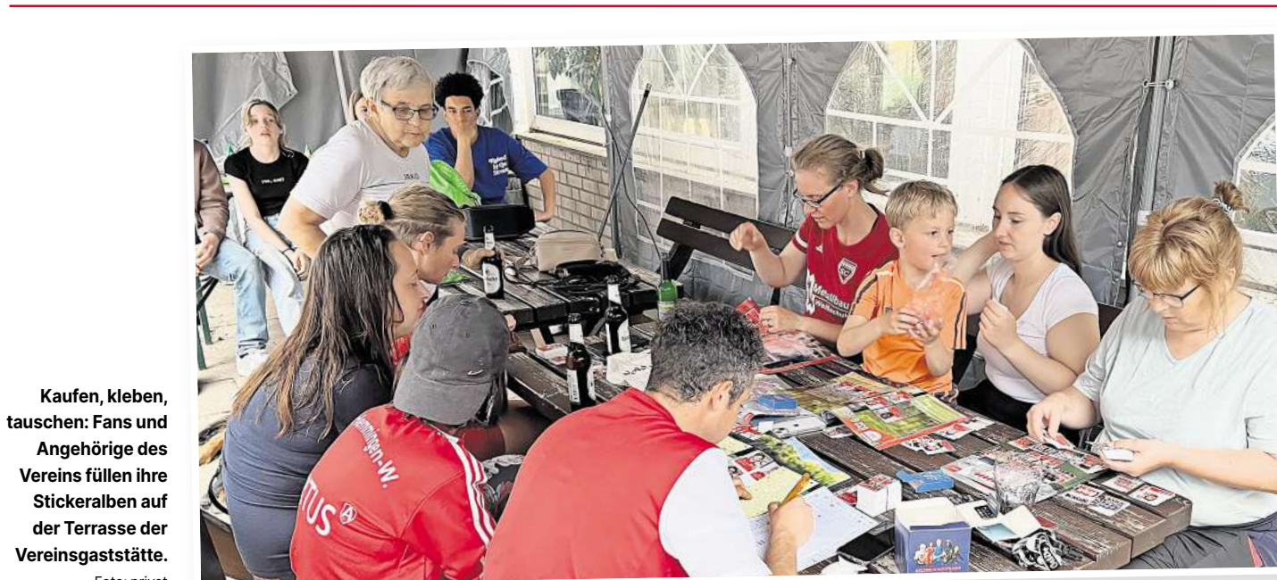
Kaufen, kleben, tauschen: Fans und Angehörige des Vereins füllen ihre Stickeralben auf der Terrasse der Vereinsgaststätte.