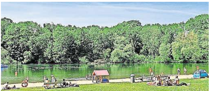
Das Strandbad in Hemmingen.