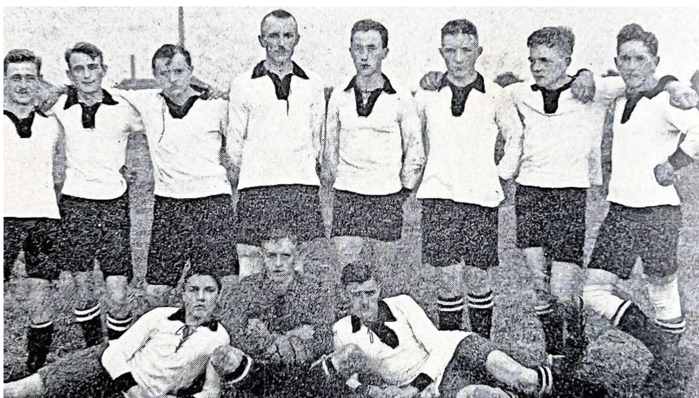
Die Mannschaft von 1923: Damals hieß der Verein noch VFV Hemmingen, trug jedoch bereits die charakteristischen, an Störche erinnernden schwarz-weißen Trikots, Hosen und Stutzen. Kleines Bild links: Beim Schauturnen der Gymnastiksparte 1979 tragen die Vorführer ebenfalls Schwarz-Weiß.

1989 feierte der Sportclub sein 75-jähriges Bestehen, u.a. mit der Einweihung eines neuen Fußball-Kleinspielfeldes. Im Jahr 2006 wurde die Fußball-Jugendabteilung mit dem Sepp-Heberger-Preis ausgezeichnet. Das Highlight im Jahr 2010 bildete das Freundschaftsspiel einer Hemminger Stadtauswahl gegen die Bundesligamannschaft von Han-