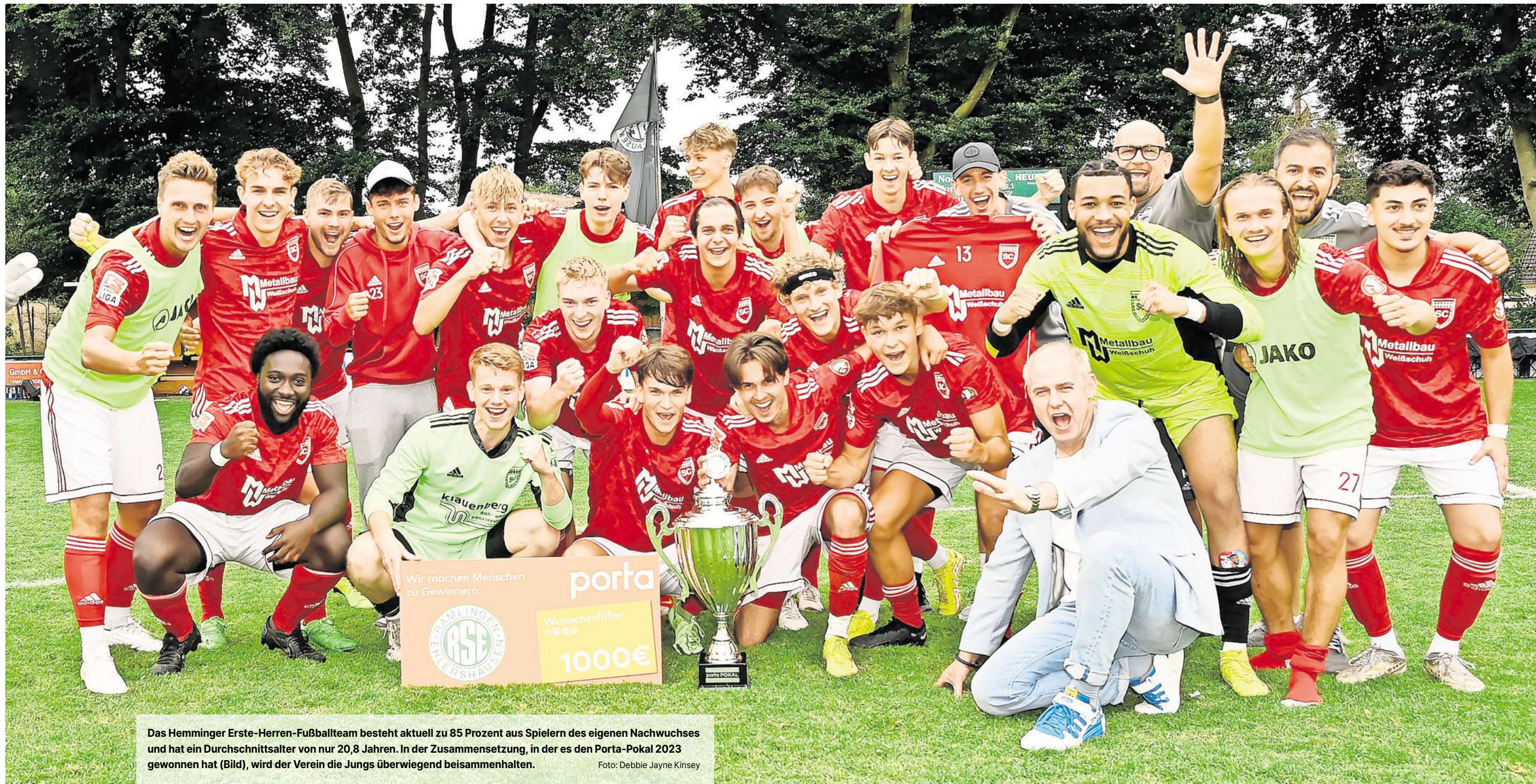
Das Hemminger Erste-Herren-Fußballteam besteht aktuell zu 85 Prozent aus Spielern des eigenen Nachwuchses und hat ein Durchschnittsalter von nur 20,8 Jahren. In der Zusammensetzung, in der es den Porta-Pokal 2023 gewonnen hat (Bild), wird der Verein die Jungs überwiegend beisammenhalten.

Hannover 96 sende mit seiner Unterstützung auch ein Signal an die Vereinspartnerschaft, die mit dem SC Hemmingen-Westerfeld seit der Gründung des Projektes 96-VEREINT im Jahr 2011 besteht und sich aktuell auch in einer „sehr guten und partnerschaftlichen Zusammenarbeit zwischen NLZ und der Jugendfußballabteilung des SCH“ widerspiegelt.