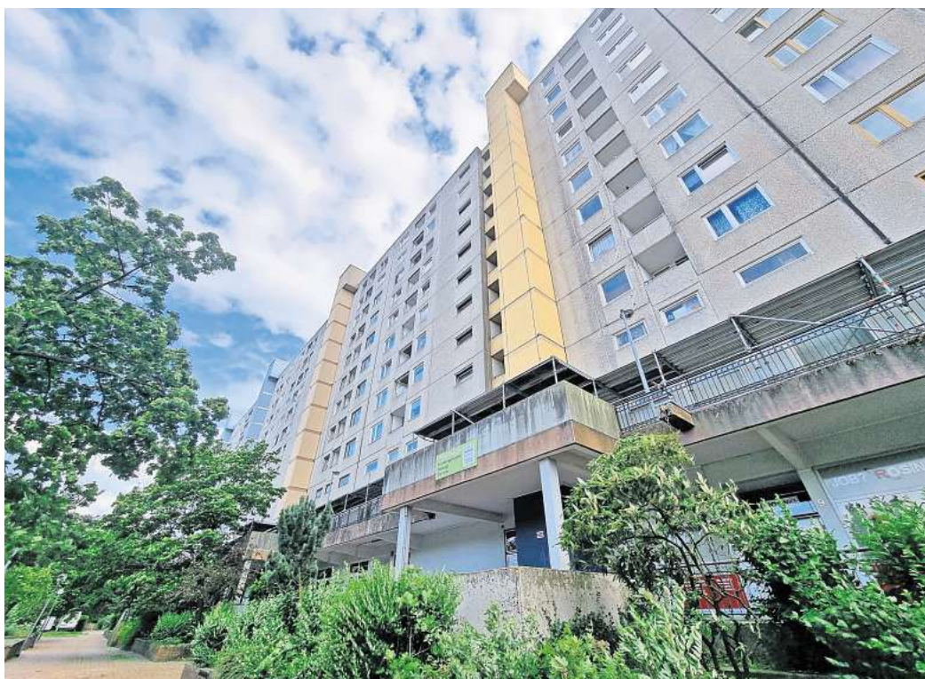
Ist verkauft: Die Wohnscheibe am Laatzen Markt.

Nach LEG-Angaben erfolgte der Verkauf im vergangenen Monat. Der Besitzübergang werde voraussichtlich am 1. Januar 2025 erfolgen. Für die Mieter solle sich durch den Verkauf „im Prinzip“ nichts ändern, teilt die LEG mit. „Kauf bricht nicht Miete“, sagt ein Unternehmenssprecher. Alle Mietverträgen bleiben bestehen. „Die Erwerberin der Immobilie wird in sämtliche Rechte und Pflichten des Mietvertrages eintreten.“ Damit beginnen die Bemühun-