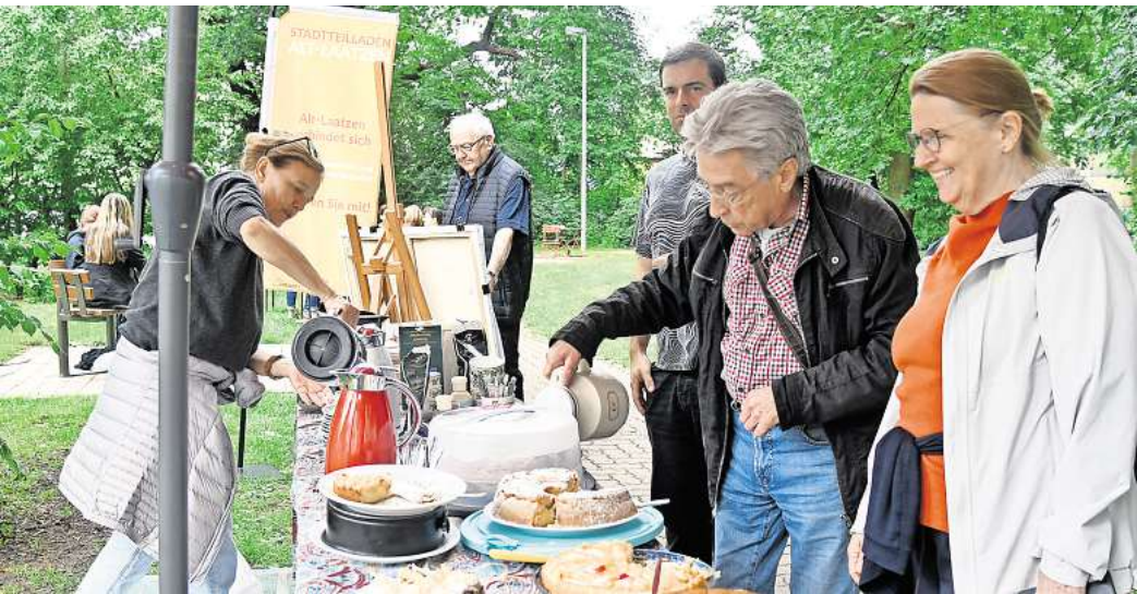
Kuchen essen und Miteinander ins Gespräch kommen: Das ist am Tag der Nachbarschaft im Park an der Eichstraße möglich.

Auch im westlichen Bereich der Grünanlage hat sich einiges getan: An der Friedhofstraße ist eine Sitzgelegenheit mit Tisch und Bänken in L-Form aufgestellt worden. „Sie und auch der Schachttisch sind auch für Menschen mit Rollstühlen und Rollatoren sowie für Eltern mit Kinderwagen gut zugänglich“, sagt Hetmeier. Vor einigen Tagen wurden außerdem