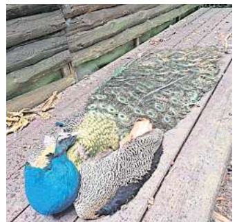
Wurde wohl am Sonntag von Menschen geschlagen und dabei schwer verletzt: Der von einigen Gästen des Wiesendachhauses „Kasimir“ genannte Pfau ist tot.

Von seinen vier Pfauen sind nun nur noch ein blauer und zwei weiße übrig, sagt Guder, der auch Hühner hält, die im Bereich des Wiesendachhauses frei herumlaufen. Anzeige bei der Polizei habe er wegen des toten Pfaus nicht erstattet: „Was soll das bringen, gegen unbekannt?“ Er wünsche sich nur eines. „Die Leute sollen die Tiere in Ruhe lassen.“