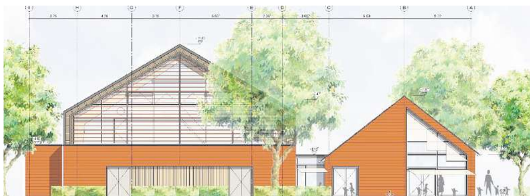
Entwurf: So könnten die neue Halle und die neue Kita aussehen.

GRÜNDACH, HOLZRAHMENBAUWEISE UND PHOTOVOLTAIK: Die Kosten steigen um 2 Millionen Euro