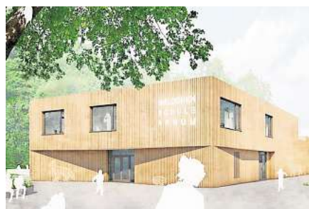
Wird teurer als geplant: der Neubau an der Grundschule in Arnum. Seite 7 Visualisierung: Pfitzner Moorhens Architekten