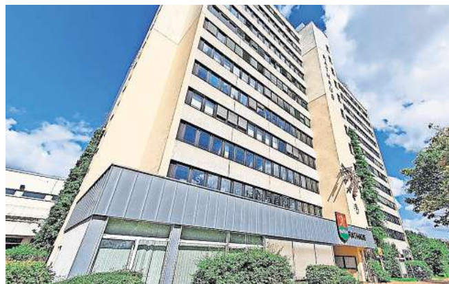
Soll abgerissen werden: Laatzens Rathaus.

Beschlusslage im Rat ist bislang, dass die Stadt eine Mietlösung sucht, eine Neubauplanung aber das Ziel bleibe. Das DRV-Gebäude ist zwar 26 Jahre alt, sieht aber noch so gut in Schuss aus, dass man auf die Idee einer Dauerlösung kommen könnte. „Ich würde es zumindest für verfrüht halten, 2026 mit den Planungen zu beginnen“, sagt Rehmert. „Vorstellen kann ich mir vieles“, sagt Grünen-Fraktionschef Weber. „Aber lasst uns erst einmal alle Schulen und Kitas fertig bauen, die wir in Planung haben. Dann gucken wir uns den Haushalt an und reden über das Thema.“ Bedenken haben die Christdemokraten. „Ich weiß nicht, ob wir uns damit einen Gefallen täten: Mit Eigentum hätten wir wenigstens etwas geschaffen“, sagt Bodenstab. Und ergänzt: „Wenn wir mieten, begeben wir uns in eine gewisse Abhängigkeit.“