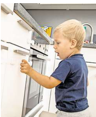
Wenn kleine Kinder ihre Welt entdecken, kann es manchmal auch gefährlich werden (gestellte Szene).

- Klar, Medikamente, Putzmittel und Elektrogeräte wie Schneidemaschinen und Mixer sollten Eltern immer unter Verschluss halten. Und auch scharfe, spitze und kleine Gegenstände, die verschluckt werden könnten, bewahren Sie am besten außerhalb der Reichweite Ihres Nachwuchses auf. Wichtig