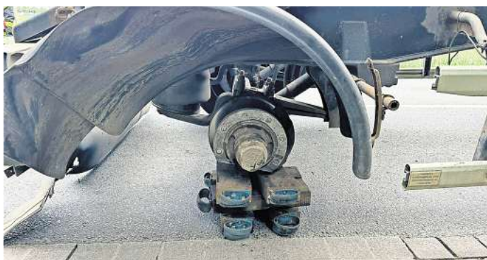
Nur noch die Felge übrig: Ein Lastwagen hatte einen Reifenplatzer und sorgte in der Folge für mehrere kleinere Flächenbrände, die von der Feuerwehr gelöscht werden mussten.