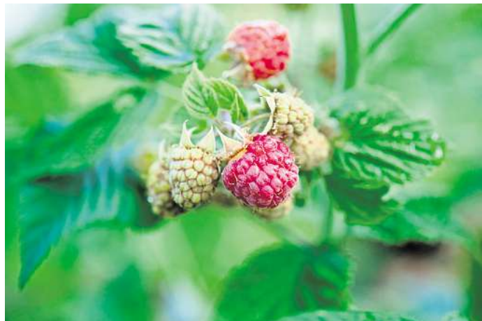
Himbeeren wachsen wild im Wald. Schatten macht ihnen deshalb nichts aus.