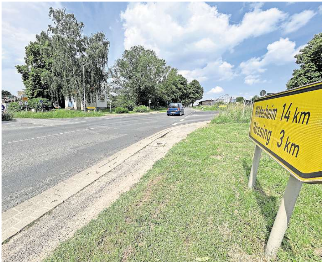
Kommt eine Querungshilfe? Noch immer ist unklar, ob an der sogenannten Domänenkreuzung am nördlichen Schulenburg Ortseingang eine Erleichterung für Radfahrer und Fußgänger geschaffen wird.

Die Stadt Pattensen hatte bereits im vergangenen Jahr rund um die Domänenkreuzung Ver-