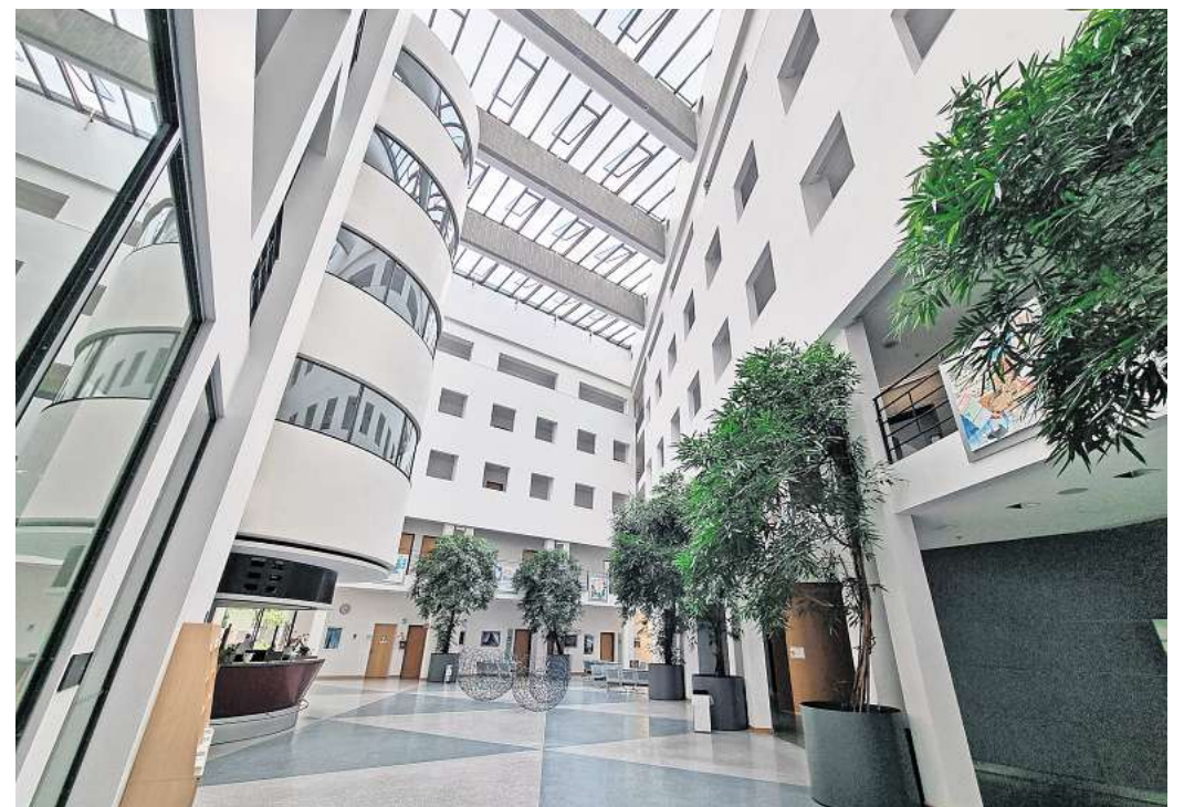
Zieht hier die Laatzen Stadtverwaltung ein? Das Auskunfts- und Beratungszentrum der Deutschen Rentenversicherung in Laatzen-Mitte.