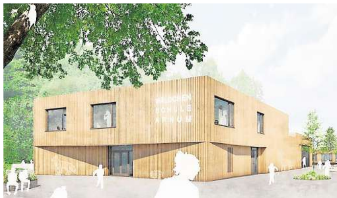
Wird teurer als geplant: der Neubau an der Grundschule in Arnum. Visualisierung: Pfitzner Moorchens Architekten

Im Zuge der Sanierung soll das Gesamtbild der Schule durch weitere Erneuerungen aufgewertet werden. So soll die Lautsprecheranlage ersetzt und die Beleuchtung auf energiesparende LED-