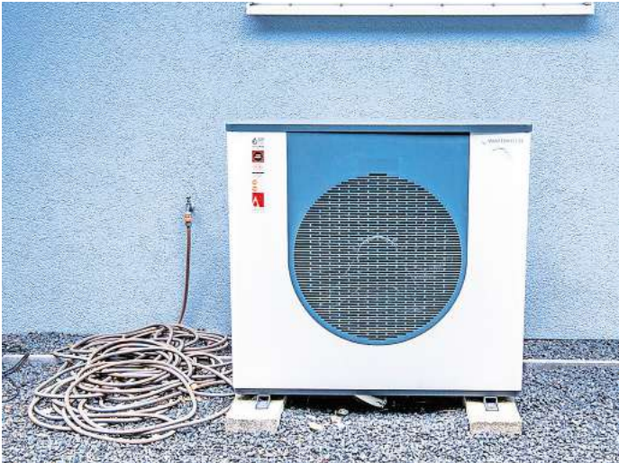
Der Verkaufshit: Die Wärmepumpe. Aber oft gilt nicht sie als der ideale Start in die Energetische Sanierung älterer Wohngebäude. Wärmepumpenbesitzer können von einem Wärmestromtarif profitieren, der jedoch mindestens einen separaten Stromzähler erfordert.

Das kommt unter anderem daher, dass Anbieter die Leistung der Geräte in Zeiten, in denen Strom besonders teuer ist, drosseln können. So kann der Strom zu günstigeren Konditionen eingekauft und weitergereicht werden.