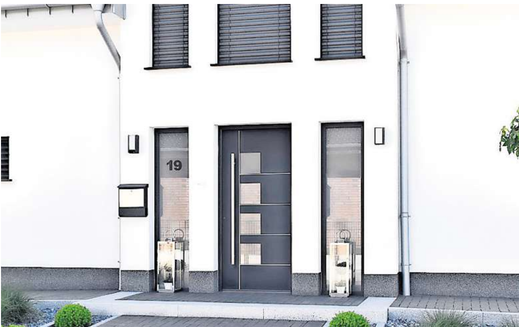
Bu Rund ums Haus Für Haustürfüllungen gibt es verschiedene Ornamentgläser und detailreiche Schmuckverglasungen, die gläserne Eleganz in den Eingangsbereich einziehen lassen.

Puristisch und gleichzeitig funktional sind etwa Ganzglas-