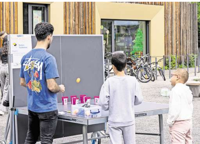
Turnier im Quartier: Am Nachbarschaftshaus in Laatzen flogen die Bälle. Punkte wurden unter anderem an der Tischtennisplatte gesammelt. Fotos: Nachbarschaftshaus Laatzen veranstaltet erstmals den Nachbarschaftstag unter dem Motto "Turnier im Quartier- Laatzen spielt zusammen". Jung und Alt probieren neue Sportarten aus.