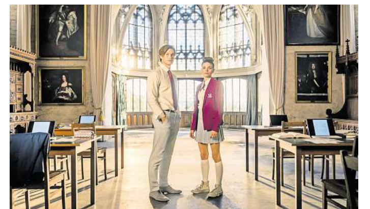
James Beaufort (Damian Hardung) und Ruby Bell (Harriet Herbig-Matten) in der Kulisse der Amazon-Serie „Maxton Hall“ auf Schloss Marienburg in Hannover.

Ruby stammt aus einfachen Verhältnissen und muss im Gegensatz zu ihren Mitschülern und Mitschülerinnen mit dem Bus zur Schule fahren. Innerhalb der Serie tauchen deshalb auf Rubys Busfahrt oft die Landstraße zum Schloss Marienburg und die Zufahrt auf. In Folge vier holt James Ruby in der Zufahrt von der Bushaltestelle ab, und beide gehen zusammen zur Schule.