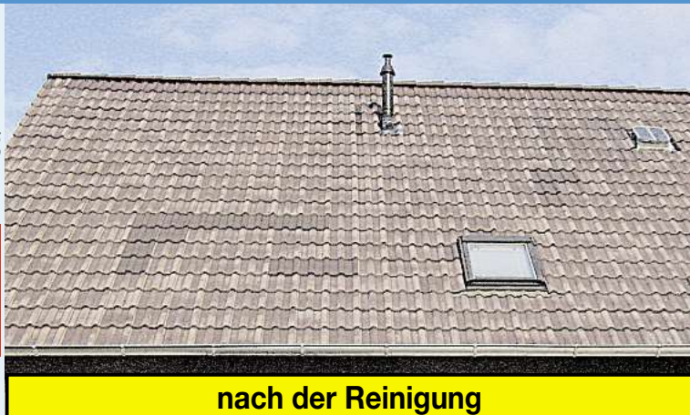
nach der Reinigung

Ein gepflegtes Dach schützt und verlängert Ihr Haus und macht es wieder funktionstüchtig. Selbstverständlich bieten wir Ihnen auch zusätzlich eine Beschichtung Ihres Daches an. Nutzen Sie jetzt dieses Angebot, es wird auch mit Beschichtung insgesamt günstiger.