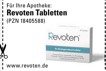
Abbildung Betroffenen nachempfunden REVOTEN: Wirkstoffe: Acidum silicicum Trit. D4, Calcium carbonicum Hahnemanni Trit. D4. Die Anwendungsgebiete entsprechen den homöopathischen Arzneimittelbildern. Dazu gehört: Bindegewebsschwäche. www.revoten.de • Zu Risiken und Nebenwirkungen lesen Sie die Packungsbeilage und fragen Sie Ihre Ärztin, Ihren Arzt oder in Ihrer Apotheke. • Remitan GmbH, 82166 Gräfelfing

So können unschöne Anzeichen von Bindegewebsschwäche wie schlaffe Haut und Cellulite natürlich von innen bekämpft werden.