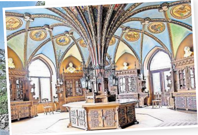
Einer der Höhepunkte im Inneren von Schloss Marienburg ist die Bibliothek von Königin Marie. Hier tagt in der Serie „Maxton Hall“ das Veranstaltungskomitee.

Im Speisesaal von Schloss Marienburg treffen Ruby und James in Folge eins das erste Mal aufeinander. Dort hält das Veranstaltungskomitee seine erste Sitzung ab und plant die Begrüßungsfeier in „Maxton Hall“.