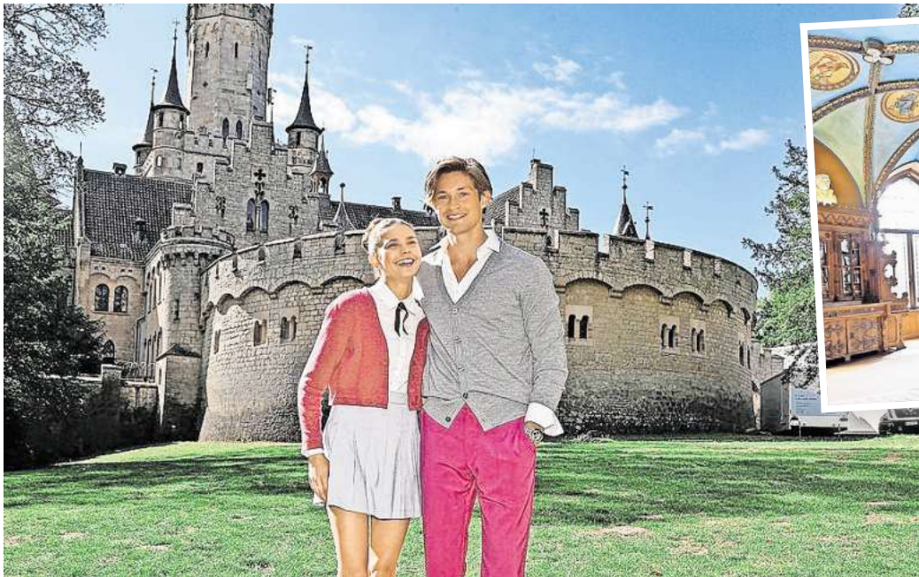
Die Serie „Maxton Hall“ und die Geschichte um Ruby (Harriet Herbig-Matten) und James (Damian Hardung) macht die Marienburg bei Pattensen aktuell zu einem Trend-Reiseziel.