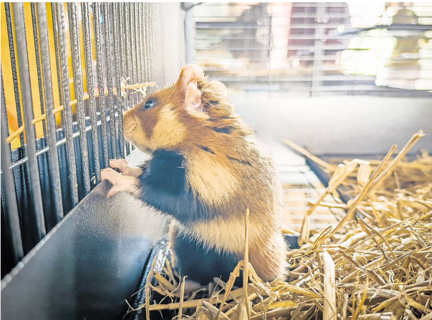
Die ersten Tiere sind eingezogen: Die Feldhamsterschutzstation in Koldingen hat am Sonntag ihre Eröffnung gefeiert. 15 Tiere werden zurzeit von der AG Feldhamsterschutz betreut.