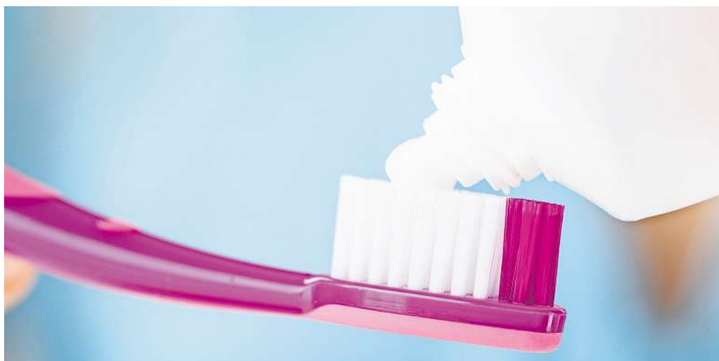
Sanft soll sie sein und sauber soll sie machen - doch nicht alle Sensitiv-Zahncremes für empfindliche Zähne schaffen das.

Dafür muss man wissen: Zahncremes enthalten winzige Putzkörper, die beim Zähneputzen Verfärbungen und Beläge abschleuern. Jede Zahncreme hat dabei ihr eigenes Profil, was die Menge, Größe und Form dieser Putzkörper angeht. Somit unter-