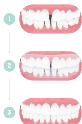
Aligner: der Weg zum Lächeln mit geraden Zähnen

Individuelle Beratung: Mit der Aligner-Therapie zum gesunden und schönen Lächeln.