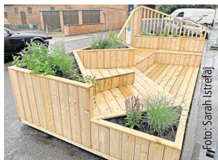
Arnum bekommt ein Parklet an der Wilkenburger Straße. Seite 4