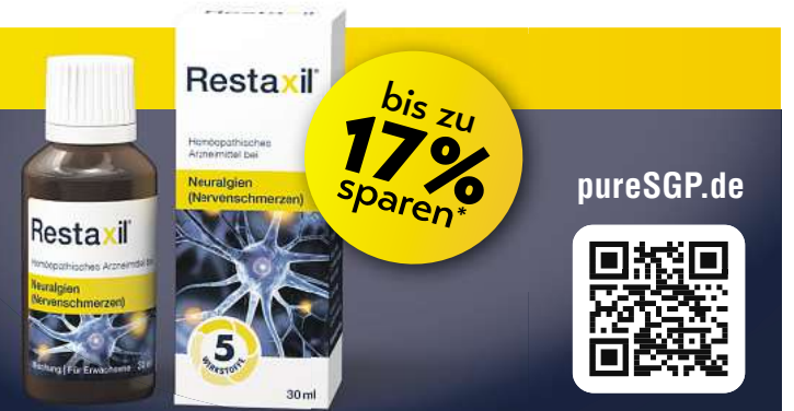
Abbildung Betroffenen nachempfunden. RESTAXIL: Wirkstoffe: Gelsemium sempervirens Dil. D2, Spigelia anthermia Dil. D2, Iris versicolor Dil. D2, Cyclamen purpurascens Dil. D3, Cimicifuga racemosa Dil. D2. Homöopathisches Arzneimittel bei Neuralgien (Nervenschmerzen). www.restaxil.de • Zu Risiken und Nebenwirkungen lesen Sie die Packungsbeilage und fragen Sie Ihre Ärztin, Ihren Arzt oder in Ihrer Apotheke. • Restaxil GmbH, 82166 Gräfelfing

Aktionszeitraum: Gültig bis 18.06.2024 bzw. nur solange Vorrat reicht.