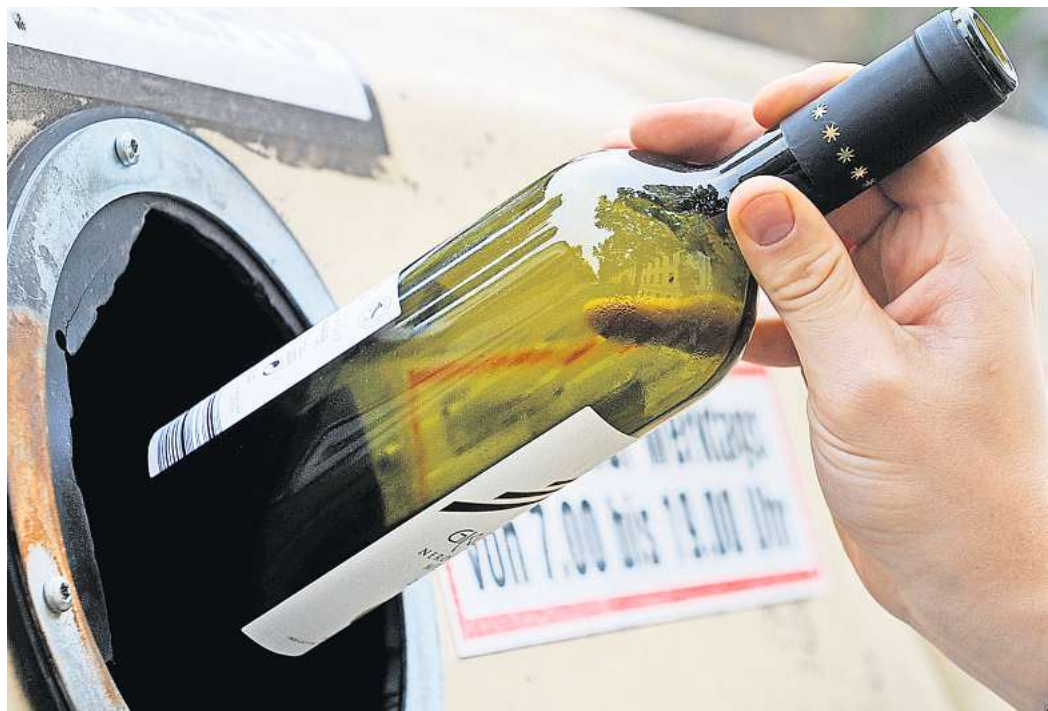
Entscheidungsfindung: Bislang konnte sich der Schulenburger Ortsrat nicht auf einen Standort für die Glascontainer einigen.

SCHULENBURGER Ortsrat und Aha für Standort – Untergrund muss befestigt werden