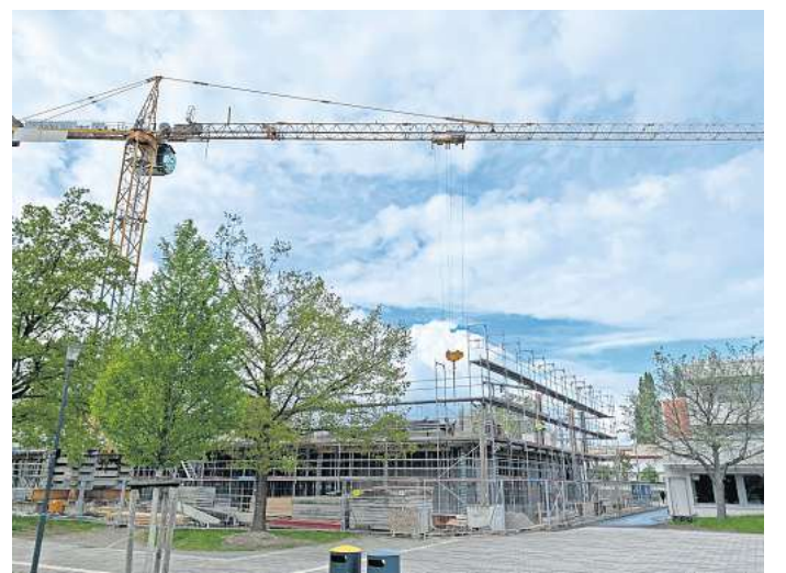
Liegt im Zeitplan: Der Bau des neuen Gebäudes für die KGS Hemmingen.

Blume nburgs rmeisterin Ob das tatsächlich so umsetzbar ist, ist hingegen ungewiss. Es könnte sein, dass die Verwaltung den Auftrag ausschreiben und an eine externe Firma vergeben muss. Dafür wären Gelder erforderlich, die aufgrund des nicht genehmigten Haushalts derzeit nicht zur Verfügung stehen. Wenn die Grundvoraussetzungen geschaffen worden sind, könnte es schnell gehen. „Nach Abschluss der Befestigungsarbeiten des Untergrundes kann die Wertstoffinsel innerhalb von 14 Tagen in Betrieb gehen“, sagt die Aha-Sprechlerin.