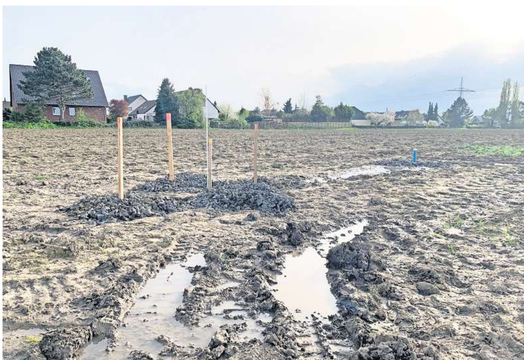
Blindgänger im Boden? Auf diesem Acker am Ortsrand von Ingeln-Oesselse, westlich des Holzweges, liegen allein drei der vier von Kampfmittelexperten ausgemachten Verdachtsstellen.

Die Arbeitsbereiche für den Kampfmittelräumdienst werden am Freitag, 26. April, mit Bauzäunen und Sichtschutz abgesperrt, so Wegener. Ab dann sind 20 bis 30 Kräfte von THW, Kampfmittelräumdienst und eine Fachfirma vor Ort. „Wir werden die Verdachtspunkte das komplette Wochenende bewachen lassen, damit sich niemand unbefugt nähern kann“, so der Stadtsprecher. Bevor die Stellen am Sonntag geöffnet werden, arbeiten sich Experten bereits bis etwa einen Meter an die Verdachtspunkte heran. Das Ziel: aus noch sicherer Entfernung mehr darüber herausfinden, was im Boden liegt.