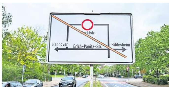
Umleitungsempfehlung: Bis zum 15. Juli wird die Marktstraße in Laatzten-Mitte voll gesperrt sein.

Weiterhin gesperrt bleibt auch die Albert-Schweitzer-Straße zwischen der Flemingstraße und der Marktstraße. Hier dauern die Straßenbaumaßnahmen voraussichtlich noch bis Ende Mai an. Die Sperrung beinhaltet auch die Ausfahrt des P1-Parkplatzes auf die Albert-Schweitzer-Straße, sowie eine wechselseitige Sper-