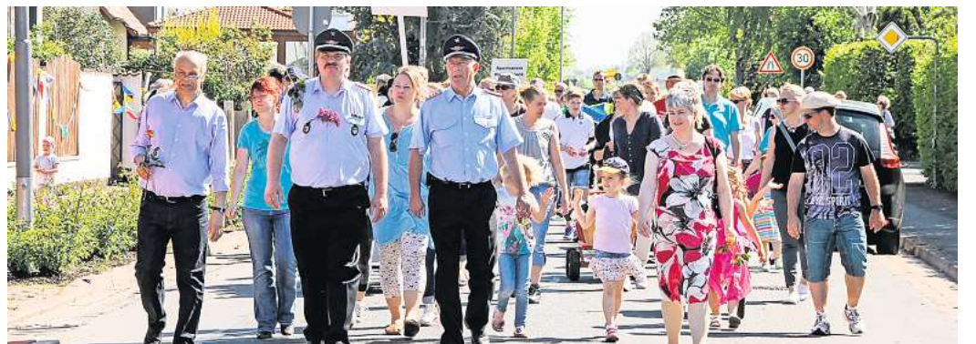
Für den Umzug am heutigen Sonabend werden rund 600 Teilnehmerinnen und Teilnehmer erwartet.

Die Höchsttemperaturen klettern laut Wetterprognosen auf 17 Grad am Sonabend und 19 Grad am Sonntag. In der Nacht zu Sonabend heißt es, sich warm zu tanzen, denn die tiefste Temperatur soll bei 3 Grad liegen. Gute Nachricht für den großen Festumzug am Sonabend: Es sieht so aus, als könne der Regenschirm zu Hause bleiben.