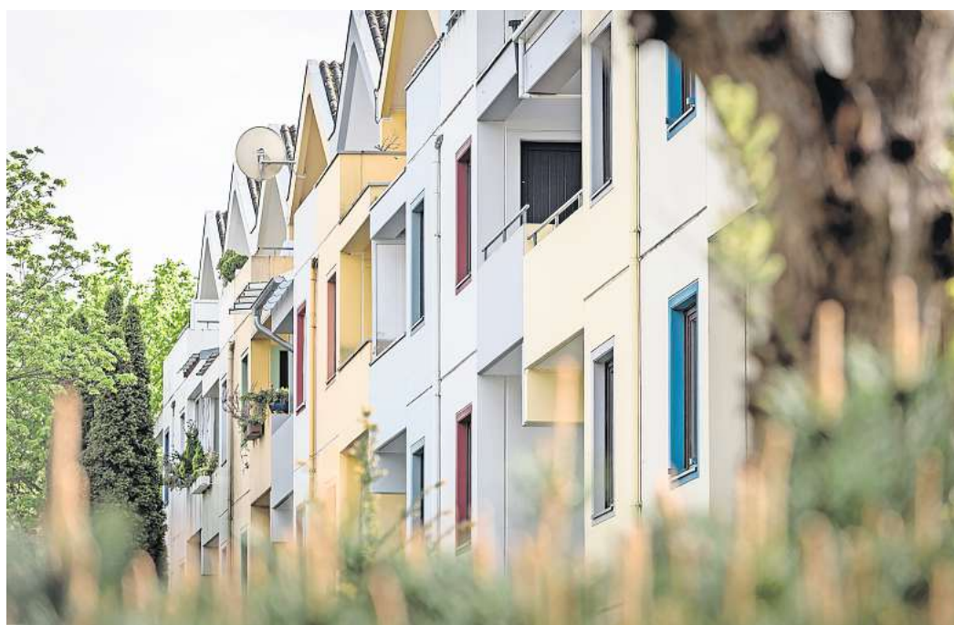
Die Mieten steigen auch bei Wohnungen in Mehrfamilienhäusern wie hier an der Langen Weihe in Laatzten-Mitte.

Vor allem für Familien mit geringem Einkommen schafft der Anstieg Probleme, aber auch mittlere Einkommen werden ihm deutlich im Portemonnaie spüren. Ein Beispiel: Wer 2019 eine 80-Quadratmeterwohnung gesucht hat, musste bei einem Durchschnittspreis von 7,42