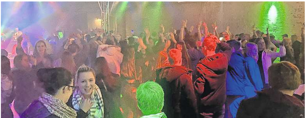
Hier wird ausgelassen gefeiert: Die Landjugend Pattensen tanzt in den Mai.

Die nächste größere Veranstaltung, bei der einige Liter Bier fließen werden, ist – man ahnt es – in Harkenbleck. Vom 26. bis 28. April feiert die Feuerwehr ihr Zeltfest.