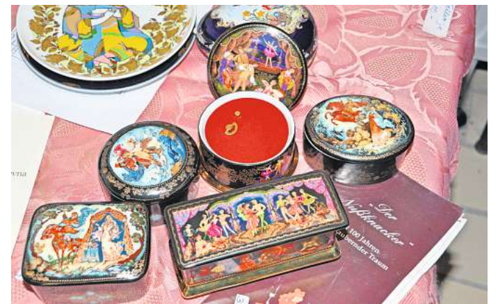
Reizvolles auf dem Bad-Flohmarkt: Zertifizierte chinesische Spieluhren lassen klassische Musik erklingen, wie den Nussknacker.