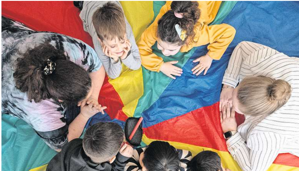
Mit einem Gesetzentwurf zur zeitlich befristeten Lockerung von Personalstandards will die rot-grüne Landesregierung den Betreuungsausfällen entgegenwirken. (Symbolbild)