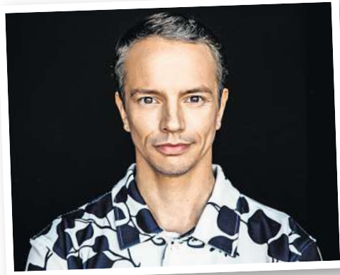
Frans Zimmer alias Alle Farben eröffnet die N-Joy Starshow.

Tagestickets für die N-JOY Starshow und das NDR 2 Plaza Festival sind jeweils für 59 Euro bei Hannover Concerts (0511/12 12 33 33, hannover-concerts.de), www.eventim.de und an allen bekannten Vorverkaufsstellen zu haben. Kombitickets kosten 109 Euro. Je nach Art der Ticketbestellung (VVK-Stelle, Telefon, Internet) können zusätzliche Gebühren für Bearbeitung und Versand hinzukommen. Kinder bis sechs Jahre haben jeweils freien Eintritt. Die Tickets berechtigen zur Nutzung der öffentlichen Verkehrsmittel an den Veranstaltungstagen im Bereich des Großraum-Verkehrs Hannover (GVH).