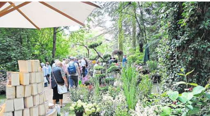
Alles rund um Garten und Genießen gibt es bei der Blumen & Ambiente.