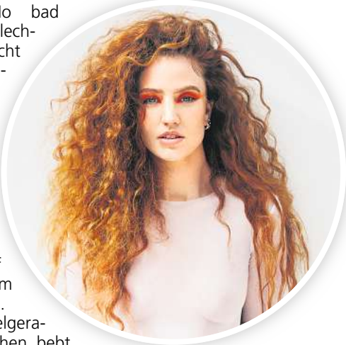
Auch sie ist dabei: Jess Glynne.

HANNOVER. „No bad Days“ – Keine schlechten Tage verspricht Macklemore auf seiner gleichnamigen Single aus 2023. Und keine schlechten Tage verspricht mit der N-Joy Starshow und dem NDR 2 Plaza Festival auch das Doppelfestival auf der Expo Plaza am 31. Mai und 1. Juni.