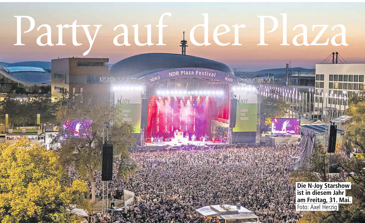
Die N-Joy Starshow ist in diesem Jahr am Freitag, 31. Mai.

HANNOVER. „No bad Days“ – Keine schlechten Tage verspricht Macklemore auf seiner gleichnamigen Single aus 2023. Und keine schlechten Tage verspricht mit der N-Joy Starshow und dem NDR 2 Plaza Festival auch das Doppelfestival auf der Expo Plaza am 31. Mai und 1. Juni.