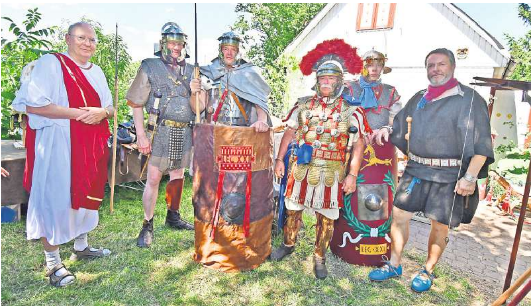
Stellen das Leben römischer Legionäre historisch korrekt nach: Mitglieder der Legion Rapax.

► Fest: Die Trinitatisgemeinde feiert ihr 75-jähriges Bestehen von Freitag bis Sonntag, 24. bis 26. Mai. Das Programm für alle Altersgruppen reicht vom Puppentheater am Freitagnachmittag sowie einer Familienfahrradtour, Tanz und Musik am Sonntagabend bis zum Gottesdienst am Sonntag um 14 Uhr mit Landesbischof Ralf Meister. Die Gemeinde, zu der Hemmingen-Westerfeld und Devese gehören, hat aber noch mehr zu feiern. So wurden beispielsweise