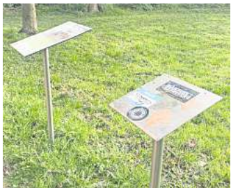
Immer wieder: Bereits zum dritten Mal sind die Schilder der Zeitreise-App am Ende der Straße Auf der Burg beschmiert oder gestohlen worden.

wohl mindestens bis Juni – bei diesem unschönen Zustand. „Es ist an diesem Standort bereits das dritte Mal“, sagt Steding. Auch an anderen Standorten verschwanden bereits Tafeln. Wie in jedem anderen Fall auch, hat die Stadt auch die jüngste Beschädigung auf der linken und den Diebstahl der rechten Tafel bei der Polizei zur Anzeige gebracht. „Wir wissen, dass diese Schilder sehr hübsch sind und vielen gefallen. Das ist sehr erfreulich“, sagt Steding. „Aber es hört auf, erfreulich zu sein, wenn so ein Schaden entsteht.“ Deshalb hat Steding die dringende Bitte: „Wer sich ein Schild gerne zu Hause aufhängen möchte, soll doch bitte ein Foto davon machen und es sich ausdrucken oder sich bei uns im Rathaus melden.“ Was passiert, wenn die Fälle in Zukunft nicht nachlassen? Wird die Zeitreise-App dann eingestellt? Steding sagt: „Der Abbau ist nicht unser