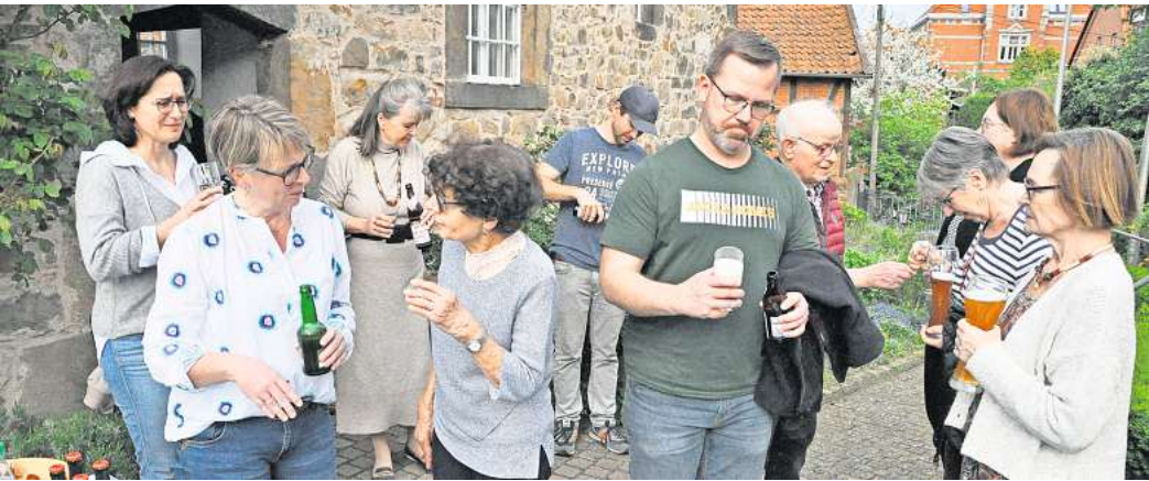
Biertasting vor der Wehrkapelle: Die Open Vitus-Gruppe der Kirchengemeinde informiert über die Geschichte des Bieres und lädt ein zur Geschmacksprobe.

Fahrzeuge vor und bereitet verschiedene Spiele für Kinder vor. Auch Rundfahrten mit dem Feuerwehrauto sind möglich. Es gibt Gegrilltes und Kuchen im Angebot. ► Schulenburg Die Schulburger Ortsfeuerwehr und der Musikzug laden für Montag, 1. Mai, ab 11 Uhr zum Schulburger Feuerwehrhaus an der Feuerwehrstraße 5 ein. Die Mitglieder des Musikzuges geben ein Konzert. Die Kinderfeuerwehr bietet eine Tombola an. Es gibt zudem Gegrilltes, Pommes, Kuchen, Kaffee und kalte Getränke. Das Ende ist für 17 Uhr vorgesehen. ► Koldingen Das Maifest des Dorfvereins Koldingen beginnt am Mittwoch, 1. Mai, um 11 Uhr am Lindenplatz. Bei Bratwurst, Pommes, Crepes, Kuchen, Gegrilltem, Eis und Getränken soll es bis 16 Uhr ein nettes Beisammensein geben. Kinder können sich schminken lassen und sich auf der Hüpfburg austoben. Dazu wird Musik gespielt.