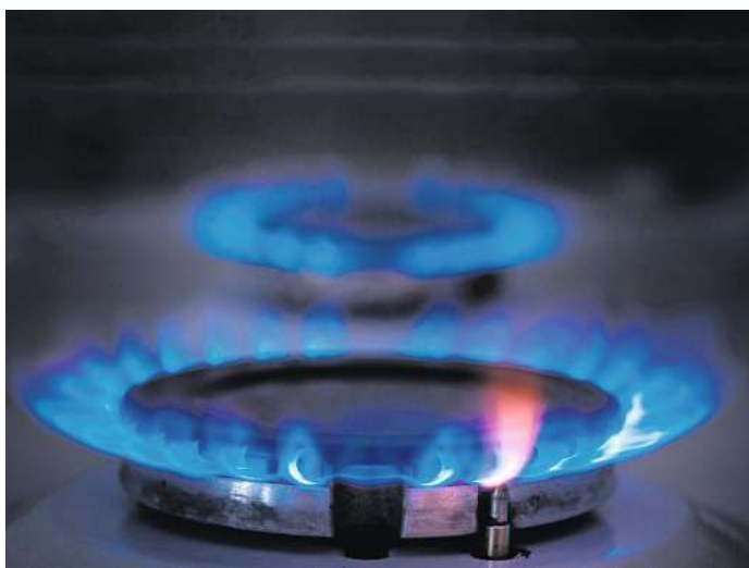
Das Gas in Pattensen und allen dazugehörigen Ortsteilen riecht bald anders. (Symbolbild)