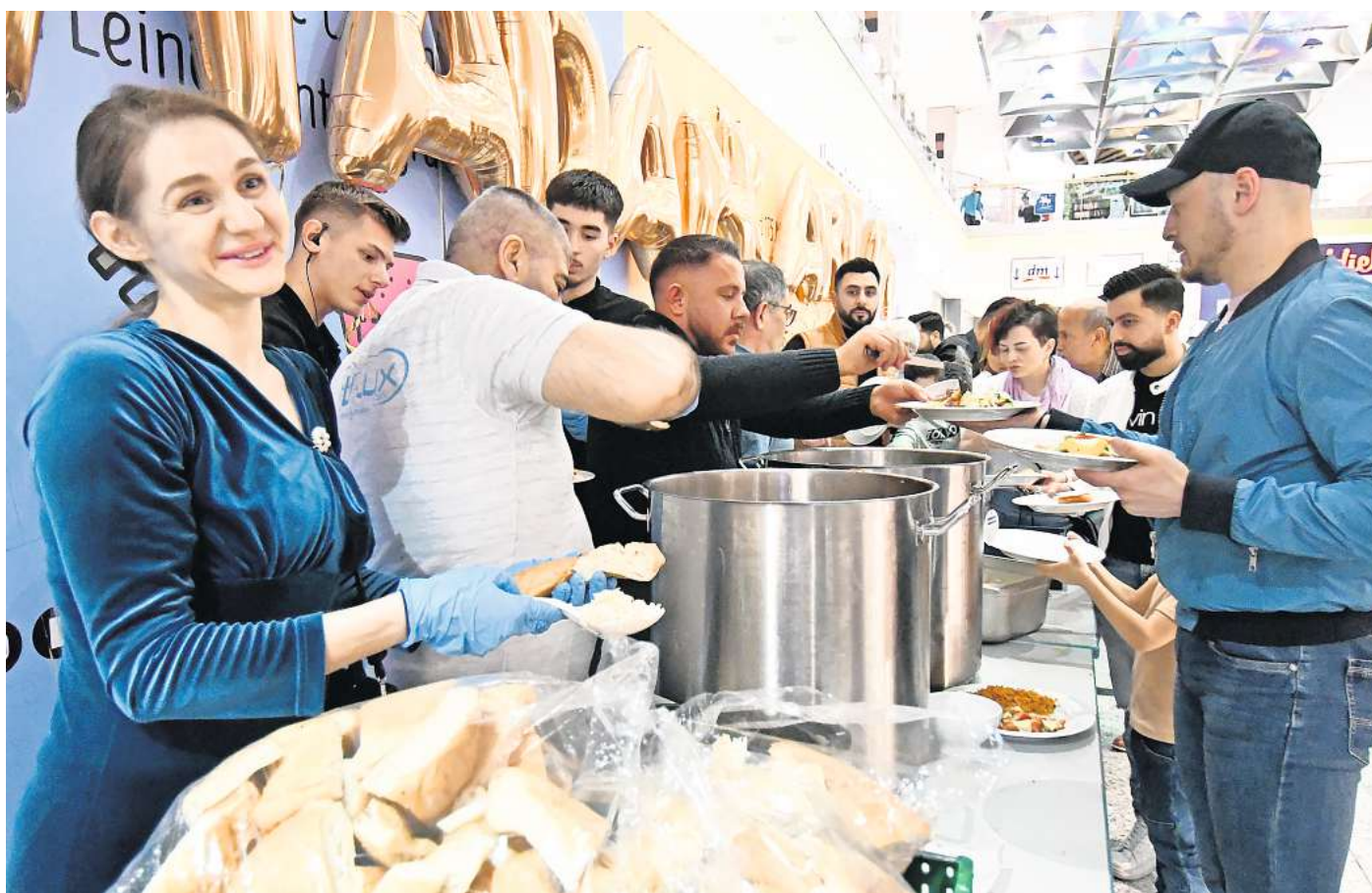
Großer Andrang: Bei der Essensausgabe können die Gäste aus zwei verschiedenen Gerichten wählen.

„Wir möchten etwas zurückgeben und das Brot mit unseren