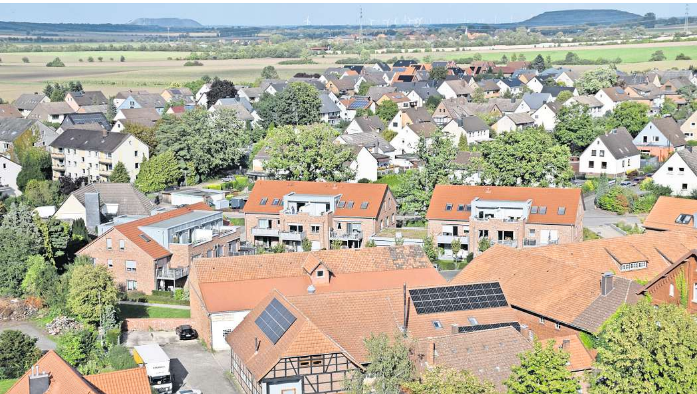
Wird zu großen Teilen geräumt: Etwa 3000 der rund 4000 Bewohner von Ingeln-Oesselse müssen am 28. April ihre Häuser verlassen, weil auf einem Feld am nördlichen Ortsrand mögliche Kampfmittel gefunden wurden.

Betroffen sind nahezu alle Adressen im Bereich von Oesselse mitsamt dem DRK-Stümpelhof und den dortigen Seniorengemeinschaften, die Sportplatz- und Feuerwehrgelände in der Ortsmitte sowie die folgenden zehn Straßen auf Ingelner Gebiet: Am Holztor 17–27, Dachsweg, Fuchsweg, Hösselgraben, Hubertusweg, Im Wiesengrund,