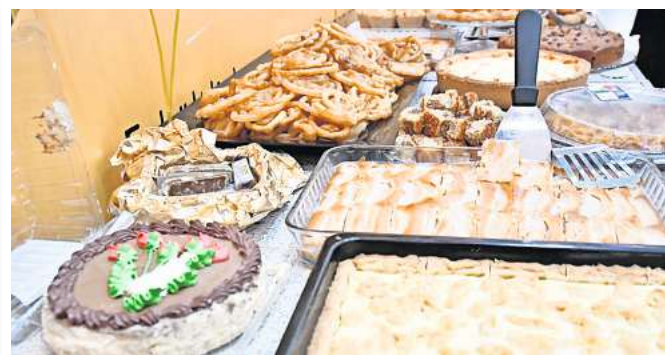
Große Auswahl: Die Desserts haben die Gäste selber mitgebracht.

Am morgigen Sonntag, 14. April, können Interessierte von 17.30 bis 19 Uhr in die ehemalige Teestube am Marktplatz 5 kommen. Dort gibt es dann Kaffee, Tee und Süßigkeiten.