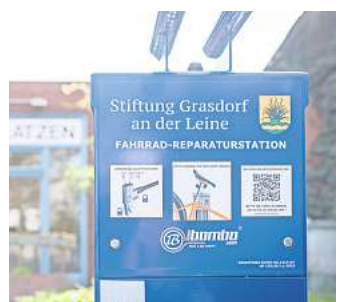
Direkt am Grünen Ring: Die Stiftung Grasdorf an der Leine hat die neue Fahrrad-Reparaturstation vor dem Nabu-Naturschutzzentrum Alte Feuerwache an der Ohestraße finanziert.

Eine weitere städtische Reparaturstation steht vor dem Rathaus am Marktplatz in Laatzen-Mitte, zudem hat die Wohnungsbaugenossenschaft Laatzen zwei weitere Säulen vor ihrer Zentrale an der Wiesenstraße 1 in Alt-Laatzen sowie an der Otto-Hahn-Straße 5 in Laatzen-Mitte installiert. Das Angebot richtet sich zwar vorrangig an Mieterinnen und Mieter, kann aber auch von anderen genutzt werden. An der mittlerweile genehmigten Bike-and-Ride-Anlage am Rethener Bahnhof will die Stadt ebenfalls eine Station einrichten. Die Verwaltung denkt zudem über weitere Standorte in Gleidlingen und Ingeln-Oesselse nach. Aufgrund der klammen Haushaltslage müssten diese allerdings – wie jetzt in Grasdorf geschehen – über Sponsoren finanziert werden.