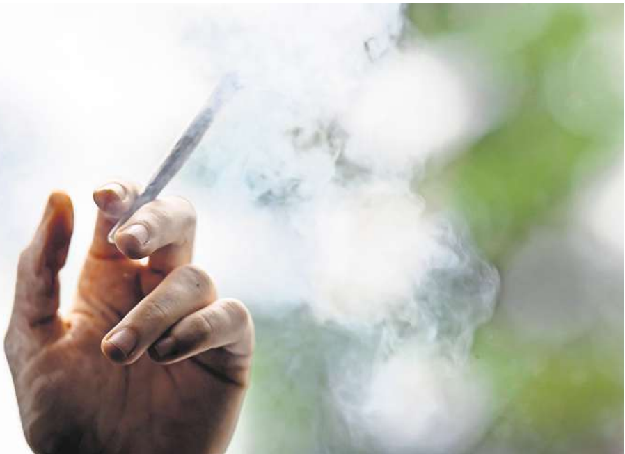
Cannabis-Legalisierung: Polizei und Jugendpflege passen sich neuen Regelungen an.