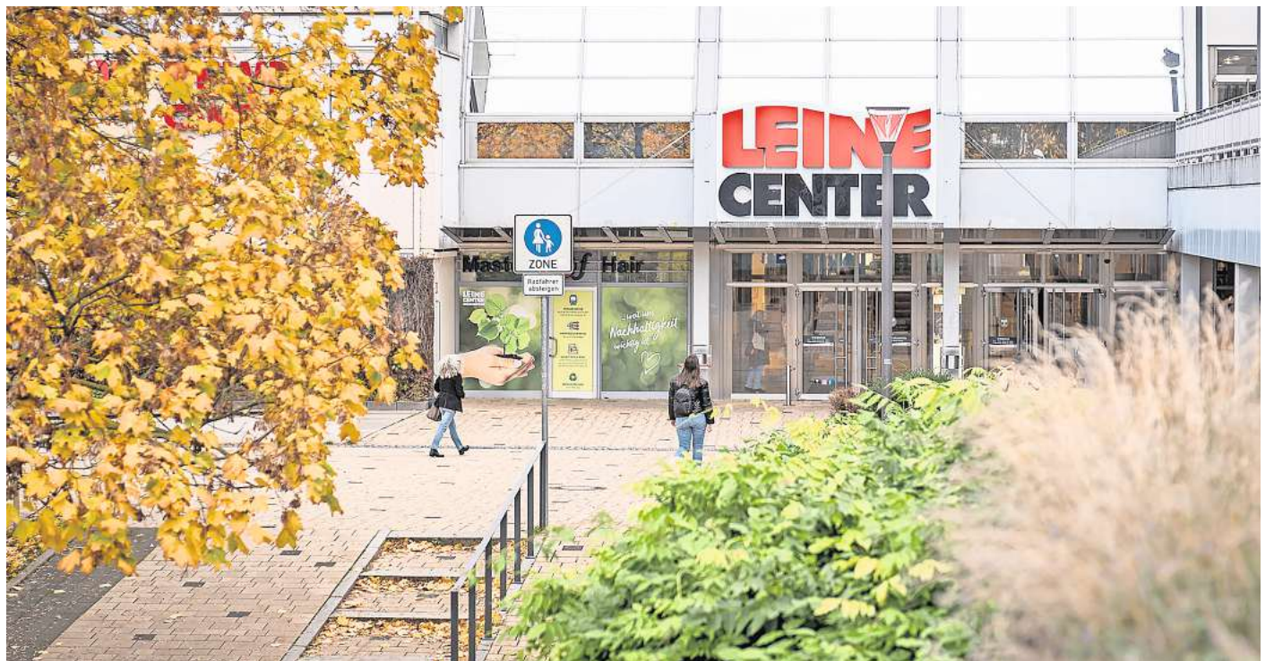
Wie geht es mit dem Leine-Center weiter? Die Gespräche laufen, heißt es beim Management.

Wie eine Ansiedlung des Discounters im Leine-Center stattdessen aussehen kann, ist offen.