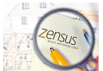
Wissen, was morgen zählt: Beim Mikrozensus 2024 werden auch Menschen aus Pattensen befragt.

Die Ergebnisse des Mikrozensus sind laut LSN von erheblicher Bedeutung für Politik und Gesellschaft. Sie dienen der Erkenntnis über die Lebensverhältnisse der Bevölkerung. Das kann beispielsweise auf soziale Probleme in bestimmten Bereichen hinweisen. „Diese Kenntnisse sind Voraussetzung für eine effektive Förderung gerade solcher Bevölkerungsgruppen, die in besonderem Maße der staatlichen Unterstützung und Fürsorge bedürfen“, teilt das LSN mit und be-