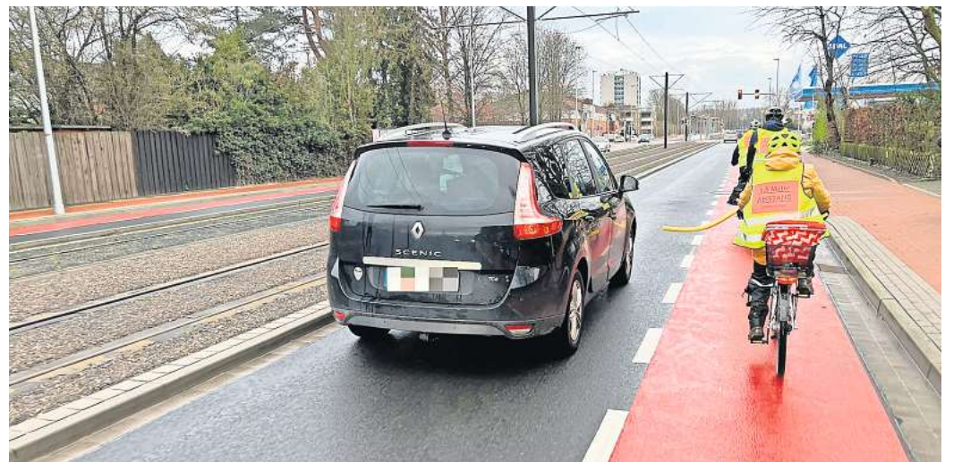
Verkehrsaktion der Grünen an der Göttinger Landstraße in Hemmingen-Westerfeld: Die Radfahrer tragen eine Warnweste und an ihrem Rad ist ein Abstandhalter befestigt.

3500 Euro stehen nun im laufenden Haushaltsplan der Stadt Hemmingen, so hat es der Rat in seiner jüngsten Sitzung beschlossen: nicht nur für Aufkleber, sondern für geeignete Projekte, die die Stadtverwaltung erarbeiten soll. Ulf Konze (CDU)