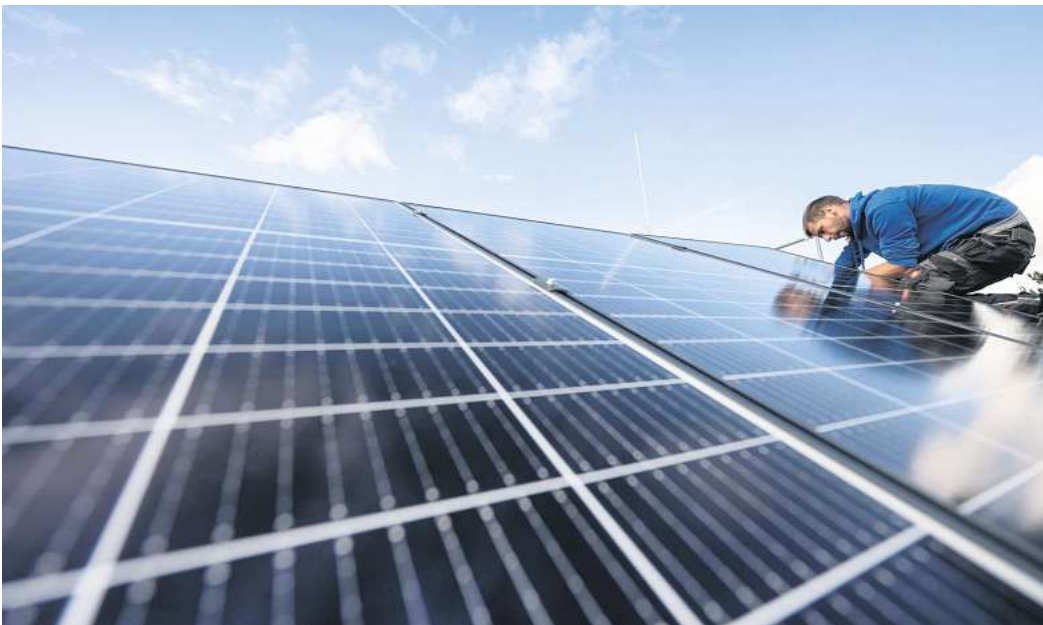
Mehr Fotovoltaik: Die Stadt hat ein Standortkonzept für mögliche Flächen erarbeitet, über das der Rat entscheiden soll. (Symbolbild)

Abhilfe soll ein Fünf-Jahres-Plan schaffen, den die Stadt jetzt angekündigt hat. Dessen Umfang ist allerdings relativ bescheiden: Eine Untersuchung von 83 städtischen Gebäuden habe ergeben, dass gerade einmal auf 16 von diesen Photovoltaikmodule