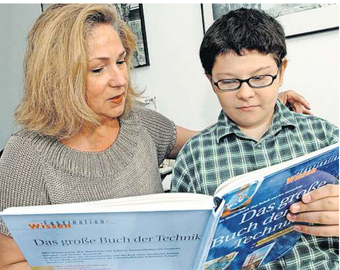
Hilfe beim Lesenlernen: Beim Mentor-Projekt unterstützen Ehrenamtliche junge Menschen.

Anmeldung und weitere Infos dazu unter bogensport-laatz@gmx.de oder https://www.vfl-grasdorf.de/sportgruppen/bogensport