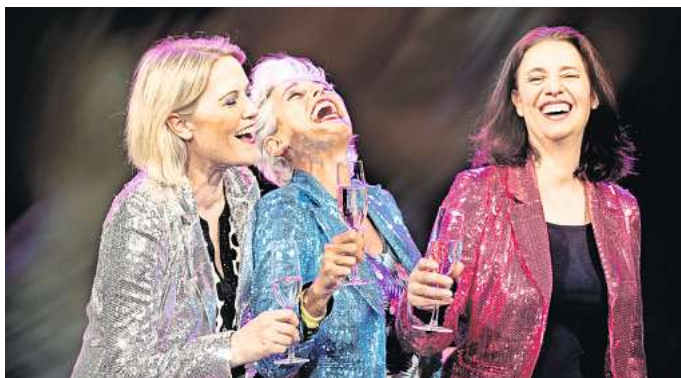
Die Beste kommt zum Schuss: Das Comedy-Trio Sekt and the City tritt im Kulturzentrum bauhof auf.