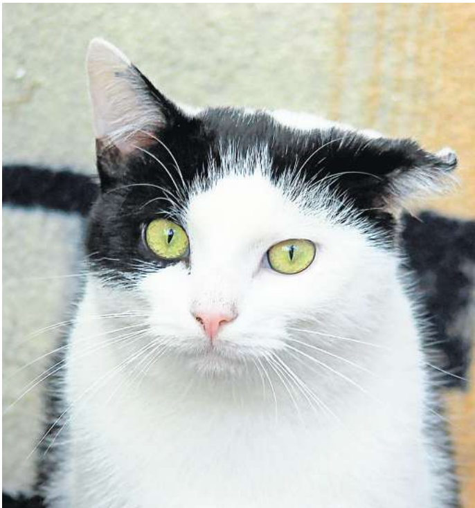
Sucht noch immer eine Festanstellung als Hofkatze: Kater Oskar.