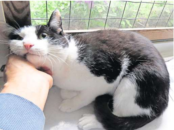
Pechvogel: der liebeswerte Kater Finjo ist bislang noch nicht vermittelt worden.