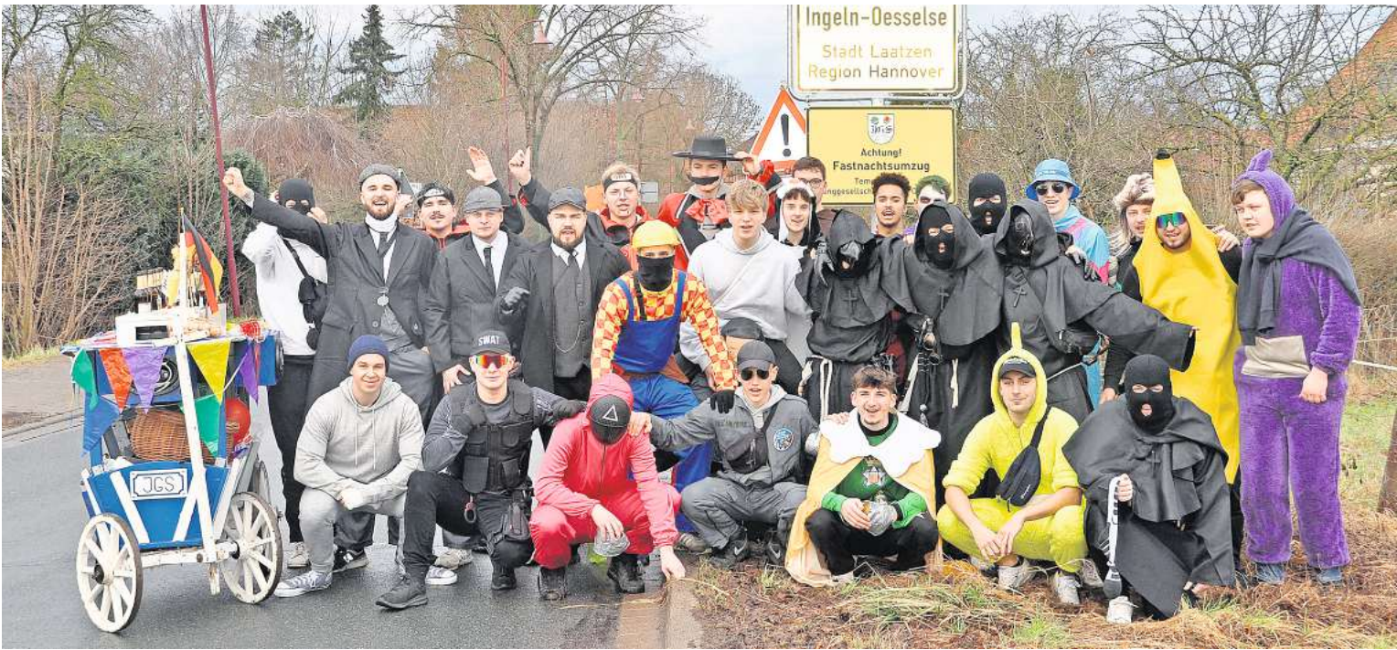
Lautstark und Spenden sammelnd am Faschingssonabend auf den Straßen des Doppeldorfs unterwegs: die Mitglieder der Junggesellschaft Ingeln-Oesselse.