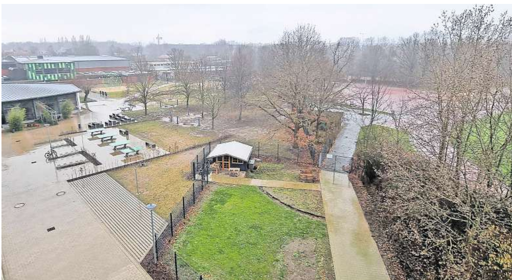
Bald kein EKS-Schulhof mehr? Der Schulgarten (vorne), die Bäume und Hügel am Sportplatz sowie die Pausenflächen zwischen Sportplatz und Mensa gehören laut bisherigem Vorschlag zum Baufeld und Pausenhof der neuen Grundschule.

Beherrschendes Thema ist das künftige Platzangebot. „Das Schulgelände des EKS wurde im