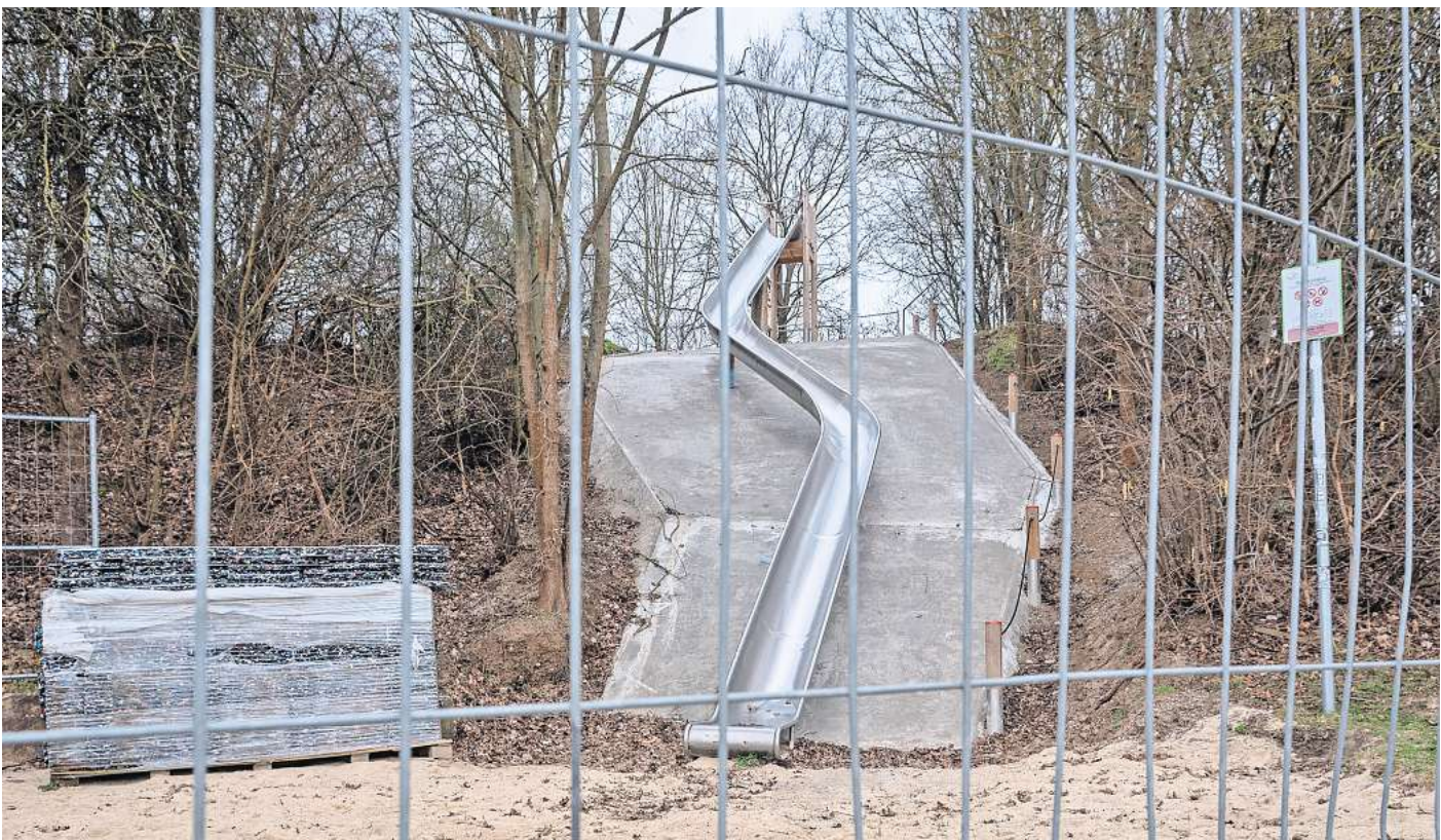
Hinter Gittern: Die Riesenrutsche am Rodelberg in Grasdorf bleibt weiterhin gesperrt.

Zuletzt gab es im Herbst Verzögerungen, weil der gegossene Betonbereich unterhalb der Rutsche nicht die erforderlichen Maße erfüllte. Die Stadt geht nun von einer Fertigstellung „im Frühjahr“ aus. Bis es so weit ist, bleibt die Rutsche durch Bauzäun