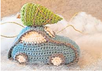
3. Platz: Sybille Müller (Lehrte) 7,8