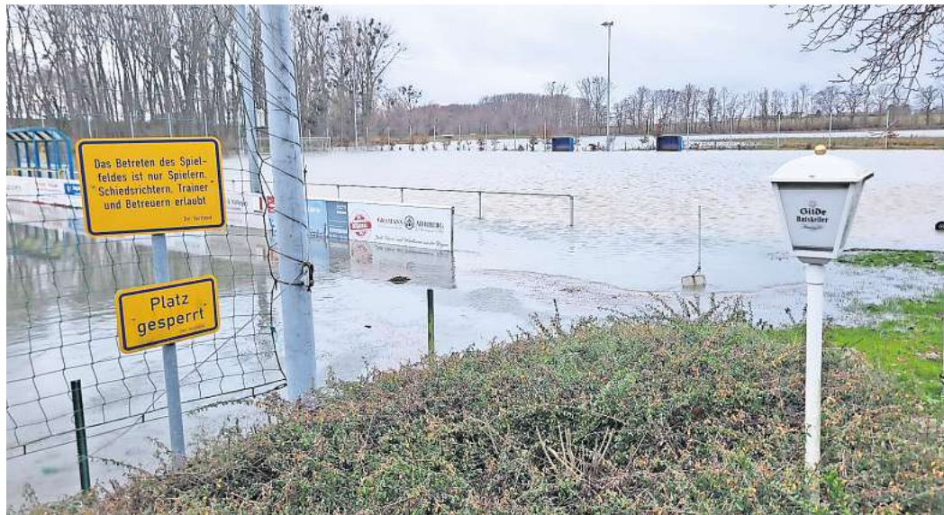
Eine große Wasserfläche: Das Sportgelände des SV Koldingen ist am Samstagnachmittag in weiten Teilen überschwemmt.

NACH HOCHWASSER fürchtet Koldingens Fußballspartenleiter um Qualität des Platzes und sieht Region Hannover in der Pflicht