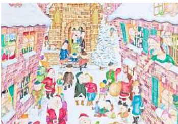
2. Platz: Uwe Schneider (Langenhagen) 22,7