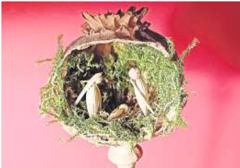
2. Platz: Gabriele Sewening (Hannover) 6,1