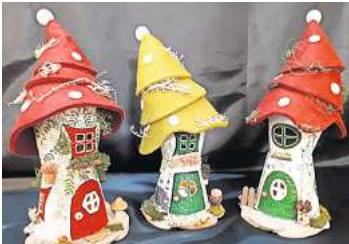
1. Platz: Anja Schade (Hannover) 10,7 Prozent