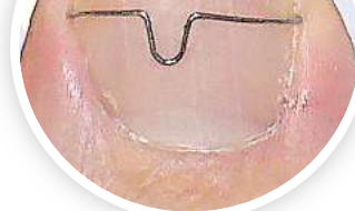
Mit einer Orthonyxiespange können eingewachsene Nägel behandelt werden.

Ein großes Thema ist auch die Behandlung von Nagelpilz. Betroffene Patienten haben oft jahrelange erfolglos Selbsttherapien angewandt, so dass oftmals nur eine Lasertherapie den leidenden Pa-