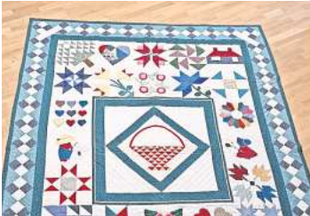
2. Platz: Brigitte Klatt (Springe) 11,3