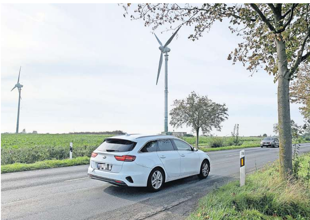
„Ingeborg“ und „Heinrich“: Die beiden Windräder sind bei aufstehendem Rotorblatt 70 Meter hoch (Nabenhöhe 50 und Rotordurchmesser 40 Meter) und drehen sich seit 1995 auf dem Streiberg zwischen Ingeln-Oesselse und Gleidingen.

Allerdings sind auch die Ausmaße der neuen Windräder gewaltig. Allein die Nabenhöhe – die Entfernung vom Boden bis zum Mittelpunkt, um den die Rotorblätter kreisen – beträgt 175 Meter. Mit aufgestelltem Rotorblatt sind es dann 261 Meter. Zum Vergleich: Die fünf derzeit größten Anlagen auf Laatze-