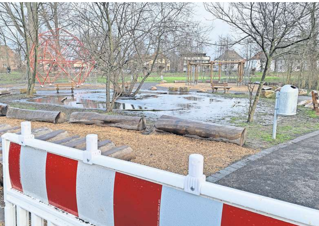
Gesperrt: der Abenteuerspielplatz an den Bruchwiesen in Pattensen-Mitte.

Derzeit kann die Stadtverwaltung nicht absehen, wann diese genauen Untersuchungen erfolgen werden. „Es muss untersucht werden, ob die Fundamente der Spielgeräte bei dem Hochwasser unterspült wurden. Der Boden könnte außerdem kontaminiert sein“, sagt Steding. Für diese genauen Untersuchungen sei eine Fachfirma erforderlich. Diese muss dann sämtliche Spielgeräte sowie stichprobenartig Bodenproben vom 2400 Quadratmeter gro-