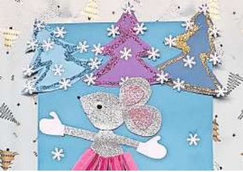
2. Platz: Anna Siminova (Hannover) 8,7