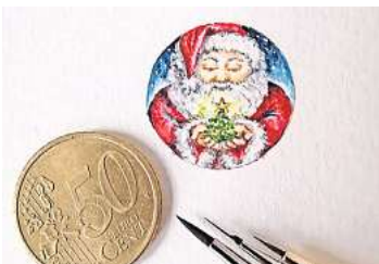
1. Platz: Marina Smirnova (Wedemark) 24,6 Prozent