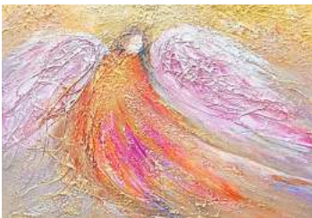
3. Platz: Martina Schramm (Garbsen) 12,6