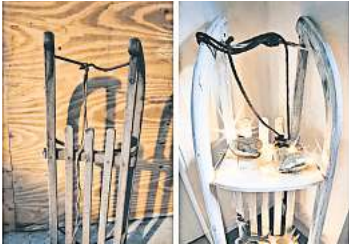
3. Platz: Julia Eichhorst (Burgwedel) 4,0