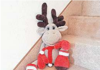
1. Platz: Bettina Tegtmeier (Ronnenberg) 23,0 Prozent