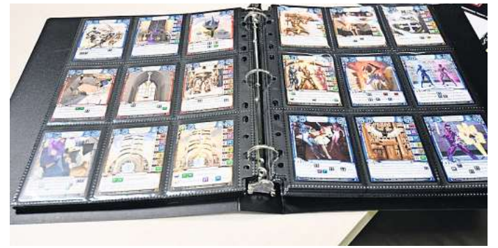
Aufwendig gestaltete Spielkarten: Zu jeder Spielbox gehören 32 Karten, mit denen sofort gespielt werden kann.

Während des Spiels versuchen die Spieler, sie daraus zu befreien. Dazu gilt es zunächst, mit sogenannten Bezwingerinnen, die mit verschiedenen Waffen ausgestattet werden können, die Zuflucht der Gegenspieler einzunehmen.