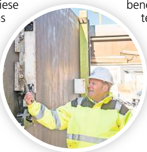
Die Schalungselemente für die späteren Fenster, Türen und andere Aussparungen werden per Magnet im WMT befestigt. Der Beton wird später von oben in den WMT eingegossen.

Das Unternehmen errichte dort ein Haus für 20 Familien auf einem bereits gekauften Grundstück, weitere Projekte seien in Planung.