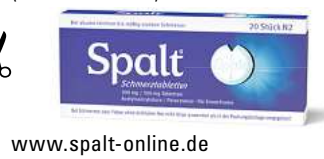
Abbildung Betroffenen nachempfunden SPALT SCHMERZTABLETTEN. Für Erwachsene bei akuten leichten bis mäßigen Schmerzen. Schmerzmittel sollen längere Zeit oder in höheren Dosen nicht ohne Befragen des Arztes angewendet werden. Bei Schmerzen oder Fieber ohne ärztlichen Rat nicht länger anwenden als in der Packungsbeilage vorgegeben! www.spalt-online.de • Zu Risiken und Nebenwirkungen lesen Sie die Packungsbeilage und fragen Sie Ihre Ärztin, Ihren Arzt oder in Ihrer Apotheke. • PharmaSGP GmbH, 82166 Gräfelfing

Für Ihre Apotheke: Spalt Schmerztabletten (PZN 08689834)