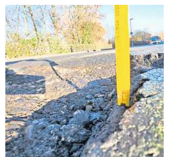
XXL-Schlagloch: Die Berliner Straße ist marode. Der Zollstock zeigt ein bis zu acht Zentimeter tiefes Loch an.

Die Berliner Straße ist laut Verwaltung eine der wichtigsten Radwegeverbindungen im Stadtgebiet. Sie ist knapp zwei Kilometer lang und verbindet die Göttinger Landstraße, also die alte B3, mit der Dorfstraße