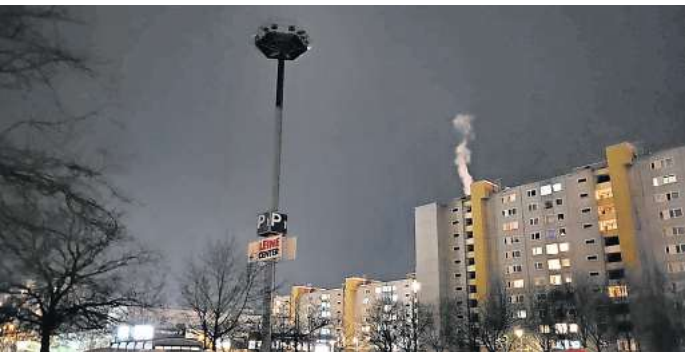
Der Parkplatz 1 bei Rewe am Leine-Center.