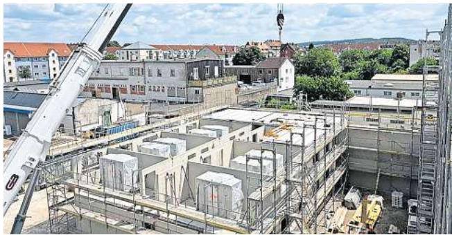
Ein Kran setzt Fertigbäder in die Gebäudehülle ein.

Die Schalungselemente für die späteren Fenster, Türen und andere Aussparungen werden per Magnet im WMT befestigt. Der Beton wird später von oben in den WMT eingegossen.