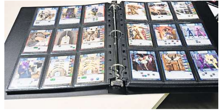
Aufwendig gestaltete Spielkarten: Zu jeder Spielbox gehören 32 Karten, mit denen sofort gespielt werden kann.

Während des Spiels versuchen die Spieler, sie daraus zu befreien. Dazu gilt es zunächst, mit sogenannten Bezwingerinnen, die mit verschiedenen Waffen ausgestattet werden können, die Zuflucht der Gegenspieler einzunehmen.