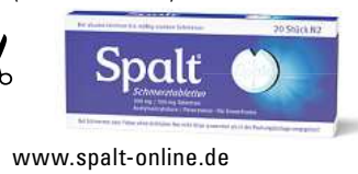
Abbildung Betroffenen nachempfunden SPALT SCHMERZTABLETTEN. Für Erwachsene bei akuten leichten bis mäßigen Schmerzen. Schmerzmittel sollen längere Zeit oder in höheren Dosen nicht ohne Befragen des Arztes angewendet werden. Bei Schmerzen oder Fieber ohne ärztlichen Rat nicht länger anwenden als in der Packungsbeilage vorgegeben! www.spalt-online.de • Zu Risiken und Nebenwirkungen lesen Sie die Packungsbeilage und fragen Sie Ihre Ärztin, Ihren Arzt oder in Ihrer Apotheke. • PharmaSGP GmbH, 82166 Gräfelfing

Für Ihre Apotheke: Spalt Schmerztabletten (PZN 08689834)