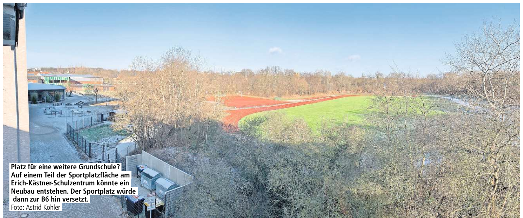
Platz für eine weitere Grundschule? Auf einem Teil der Sportplatzfläche am Erich-Kästner-Schulzentrum könnte ein Neubau entstehen. Der Sportplatz würde dann zur B6 hin versetzt.

Wibke Lonkwitz, Pastorin an der BBS Springe