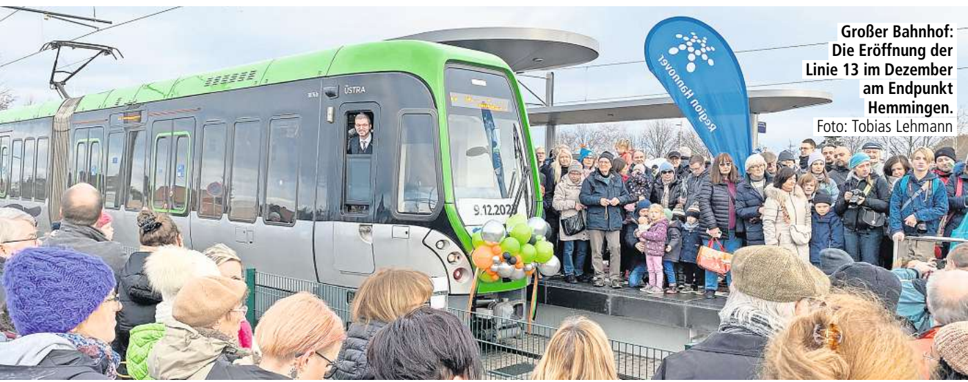
Großer Bahnhof: Die Eröffnung der Linie 13 im Dezember am Endpunkt Hemmingen.