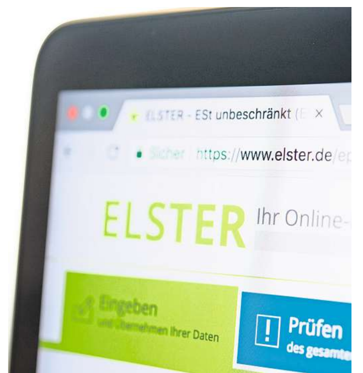
Phishingversuch: Angebliche E-Mails von „Elster“ locken mit Steuerrückzahlungen. Verbraucherzentrale, Finanzbehörden und Polizei raten zum sofortigen Löschen der E-Mail.

Die E-Mails sollten ohne Antwort gelöscht werden, lautet der übereinstimmende Tenor von Verbraucherzentrale, Finanzbehörden und Polizei. „Die Steuerverwaltung wird in einer E-Mail niemals Informationen wie die