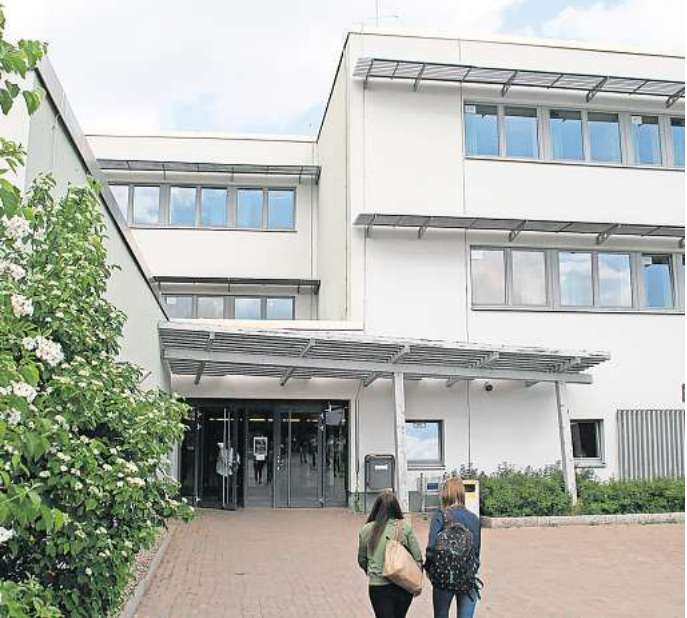
Mitglieder eines möglichen Jugendparlamentes müssen in Hemmingen wohnen, nur dort eine Schule besuchen reicht nicht aus.

Die nächste Kartierung läuft von Montag, 15. Januar, bis zum 15. März. Dieses Jahr wird sich der Zeitraum, in dem Ehrenamtliche Biberspuren suchen, aber verkürzen. Denn in viele Gebiete können sie wegen des Hochwassers noch immer nicht gelangen.