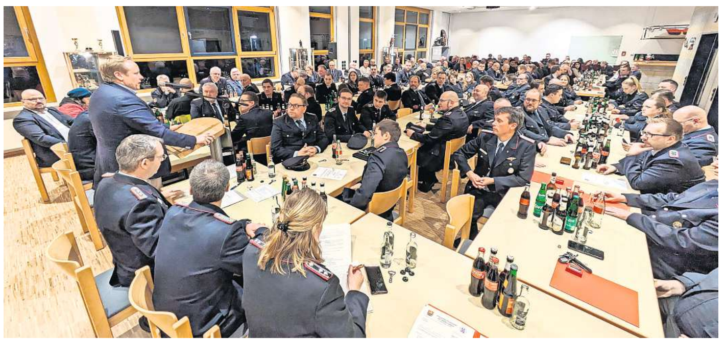
Solidarität nach dem Angriff in der Silvesternacht: CDU-Bundestagsabgeordneter Tilman Kuban spricht bei der Jahreshauptversammlung der Feuerwehr in Laatzen.