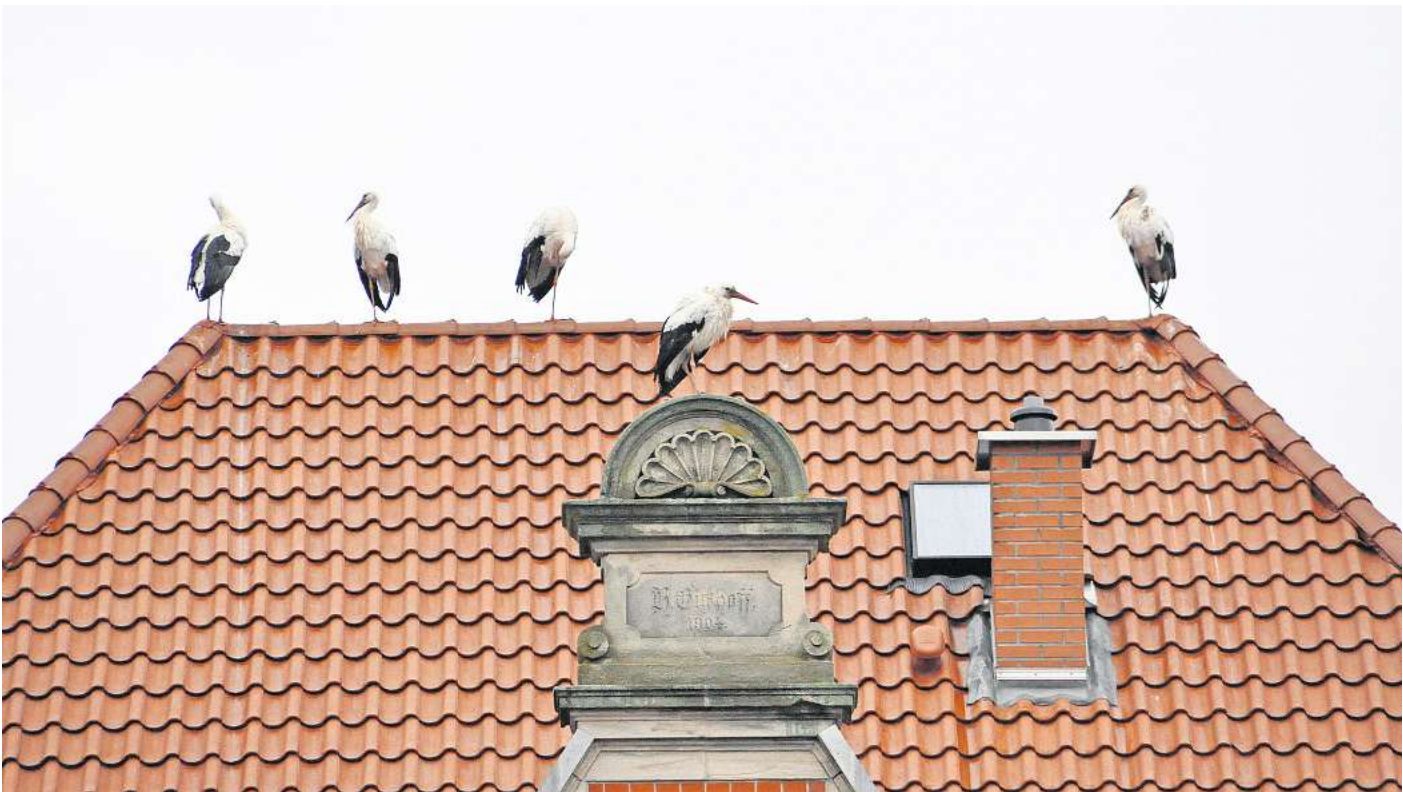
Tag und Nacht auf Harkenblecks Dächern und auf den Feldern ringsherum: Eine Gruppe von insgesamt acht Störchen verzichtet bislang auf den Flug ins warme Winterquartier im Süden.

Außerdem dauert es nicht mehr lange, dann kehren die anderen Störche aus ihren Winterquartieren ohnehin zurück. In Alt-Laatzten zum Beispiel nahm 2023 Störchin Käthe bereits Anfang Februar ihr angestammtes Nest wieder in Besitz.