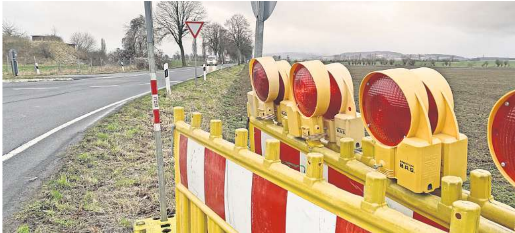
Wird gesperrt: Die Landesstraße 402 zwischen Pattensen und Hüpede erhält in Teilen eine neue Asphaltdecke.

Flurstück umfasst mit rund 37.000 Quadratmetern und einer Tiefe von etwa zehn Metern ein Deponievolumen von insgesamt etwa 336.000 Kubikmetern, abgedeckt laut Region mit einem Gemisch aus Boden und Straßenkehrschicht. Bei den jüngsten Untersuchungen wurden bis zu acht Meter tiefe und für Deponien typische Auffüllungen entdeckt. Diese Schicht ist mit einer 0,5 bis 1,40 Meter dicken Schicht aus Mutterboden überlagert. Im nördlichen Teil der Alttablagerung wurden in der Schicht geringfügig über dem Vorsorgegrenzwert der Bundes-Bodenschutz- und Altlastenverordnung erhöhte Zink- und Nickelgehalte festgestellt. „Eine Gefährdung über den Pfad Boden – Mensch ist allerdings nicht zu erwarten“, erläuterte Borschel.