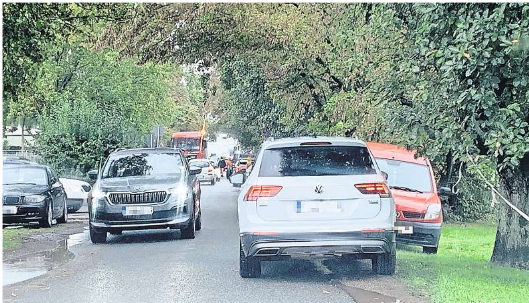
Nadelöhr Hohe Bünte: Die Fahrzeuge zwängen sich durch die Sackgasse.

Die KGS nennt dann – ebenfalls mit einem Augenzwinkern – noch sechs „besonders spezielle Sonderfälle“. Beispielsweise: „Mein Kind muss heute und überhaupt immer einen Kontrabass und einen Zement sack transportieren.“ Oder: „Bei Regen/Sonne/Wetter im Allgemeinen könnte mein Kind aufweichen/austrocknen/irgendwelchen Schaden nehmen.“ Und: „Ehrlich, allein findet mein Kind den Weg niemals!“