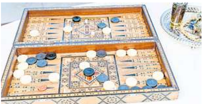
An jedem Montag ab 16 Uhr können Interessierte ab zehn Jahren Backgammon lernen.

nerinnen und -partner finden sowie ihre Fähigkeiten verbessern. Das beliebte Brettspiel ist eine Mischung aus Strategie- und Würfelspiel. Anmeldungen nimmt das Familien- und Seniorenbüro im Stadthaus telefonisch unter (0511) 8205-5423 entgegen.