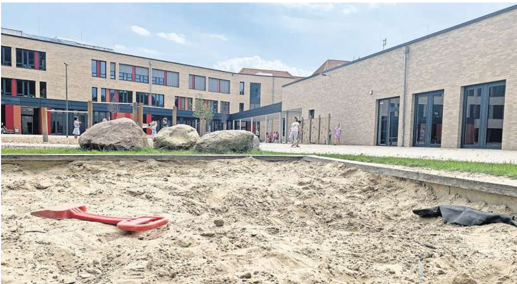
Ohne Sonnenschutz: Auf dem Schulhof der Grundschule Pattensen haben die Kinder derzeit wenig Schatten.