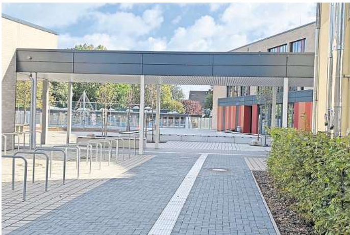
Der Schulhof der Grundschule Pattensen an der Marienstraße soll umgestaltet werden.

Steding kündigt an, dass es nicht zwangsläufig bei Maßnahmen für die Grundschule an der Marienstraße bleiben müsse. „Die Mitglieder der Lenkungsgruppe für den Grundschulneubau in Schulenburg werden nun noch einmal aus einem anderen Blickwinkel auf die Gestaltung des Schulhofes dort schauen“, sagt die Sprecherin.