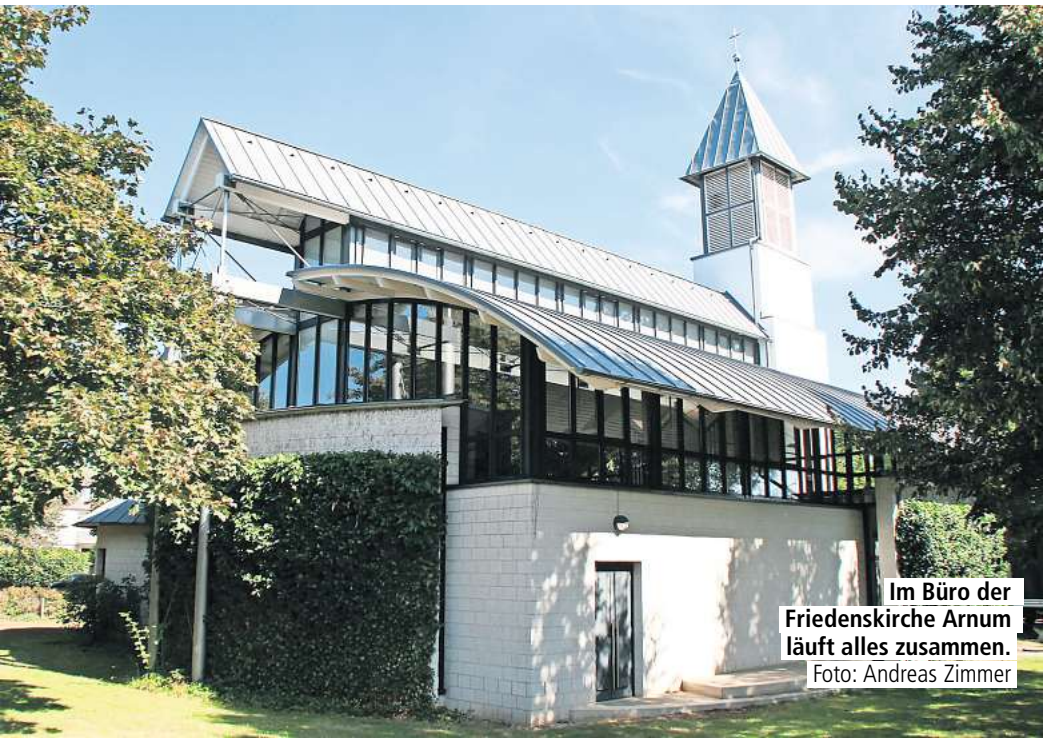
Im Büro der Friedenskirche Arnum läuft alles zusammen.

„Wir glauben, dass das eine gute Idee ist, um der Situation zu begegnen“, sagt Seidel. Geplant ist, dass das Gemeindebüro in Arnum dann montags bis freitags von 10 bis 12 Uhr geöffnet ist. Dafür wird es in den drei anderen Gemeinden nur noch ein bis zwei Sprechstunden in der Woche geben. „Dennoch