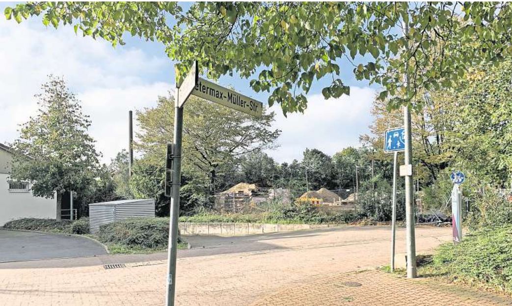
Geplanter Durchstich: Wo bisher nur Fußgänger von der Pattenser Straße zur Petermaxmüller-Straße und der Buswendeschleife kommen, sollen künftig auch Autos fahren.

Im Sinne der Sicherheit für Fußgänger ist östlich der künftigen Einmündung zur Petermaxmüller-Straße eine Ampel vorgesehen, aber nicht verpflichtend,